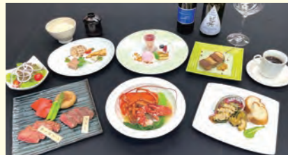
活けオマール海老と活け鮑付き くまもと黒毛和牛「和玉」鉄板焼きコース