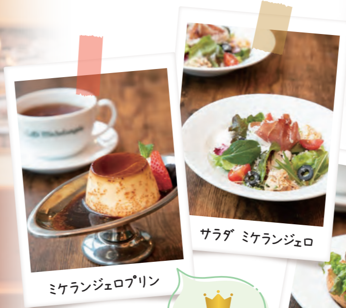
ミケランジェロプリン