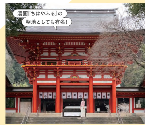
漫画『ちはやふる』の 聖地としても有名!