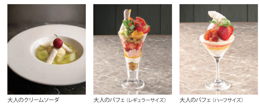
大人のクリームソーダ 大人のパフェ (レギュラーサイズ) 大人のパフェ (ハーフサイズ)