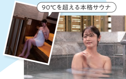
90℃を超える本格サウナ

琵琶湖に面する『ザ グラン リゾート 近江舞子』は、風光明媚な風景を身近に感じながら、ゆったり穏やかに過ごせるレイクリゾートです。