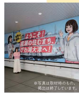
※写真は取材時のもの。 掲出は終了しています。