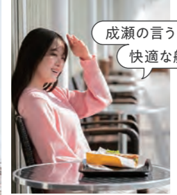
成瀬の言うとおり、 快適な航路ですね