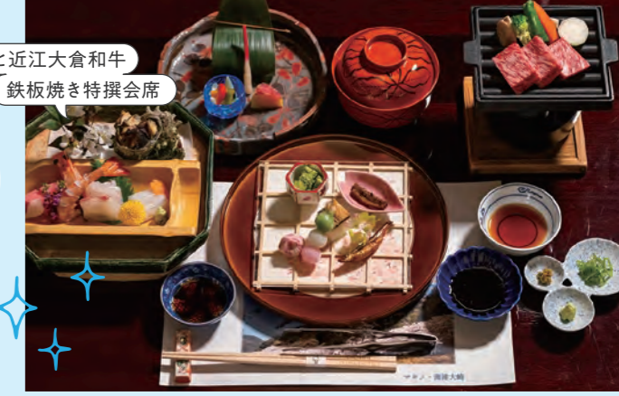
鮎唐揚げと近江大倉和牛 鉄板焼き特撰会席

館内の大浴場には、内風呂と露天風呂を用意。さらにサウナと水風呂も備えられています。