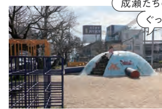
成瀬たちの日常に ぐっと近づける