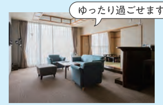
ゆったり過ごせます

客室は、和室・洋室どちらも用意。開放感ある特別室(スイートルーム)や、隣り合う2部屋をつなげて使える連結扉付きの客室もあり。グループでの滞在も◎。