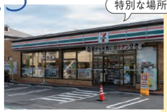
コンビニも 特別な場所!