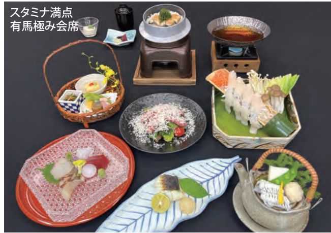
スタミナ満点 有馬極み会席