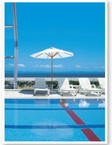
GRE淡路島 開閉式屋内温水プール

小学生(お子様ディナー) 8,640円 小学生未満(幼児ディナー) 5,400円 ※プリンセス有馬の鉄板焼きコースは上記料金に準じます。