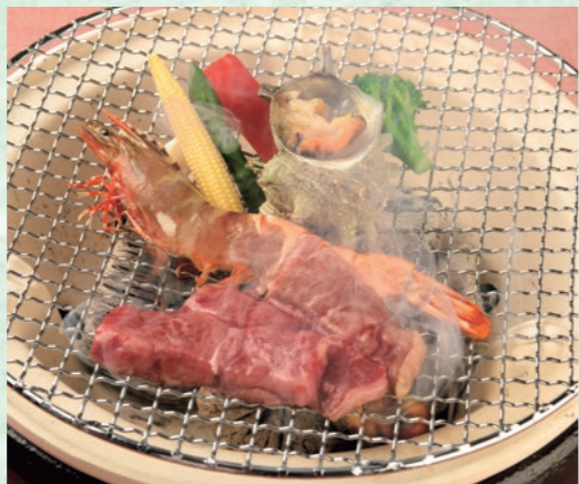
台の物 炭火焼き 身が締まってコリコリした栄螺(さざえ)はやみつきになる食感。野菜も料理長が徹底した目利きで選んだものばかりです。