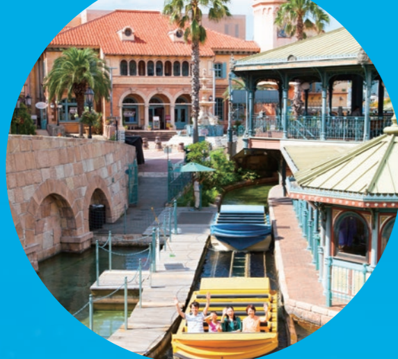
和歌山マリーナシティ