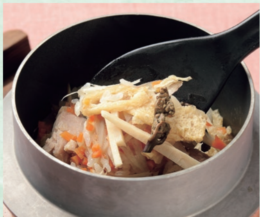
紀州梅鶏の釜飯 梅エキスを食べて育てられた梅鶏。筍や蕨(わらび)とともに炊き合わせると、風味が重なり合い、口中にじわっとうまみが広がります。