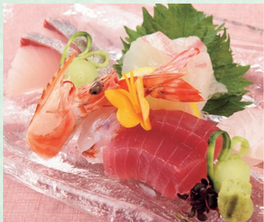
造り 五種盛り合わせ 間八(かんぱち)や縞鰯をはじめ、生きの良い五種を盛り付けました。