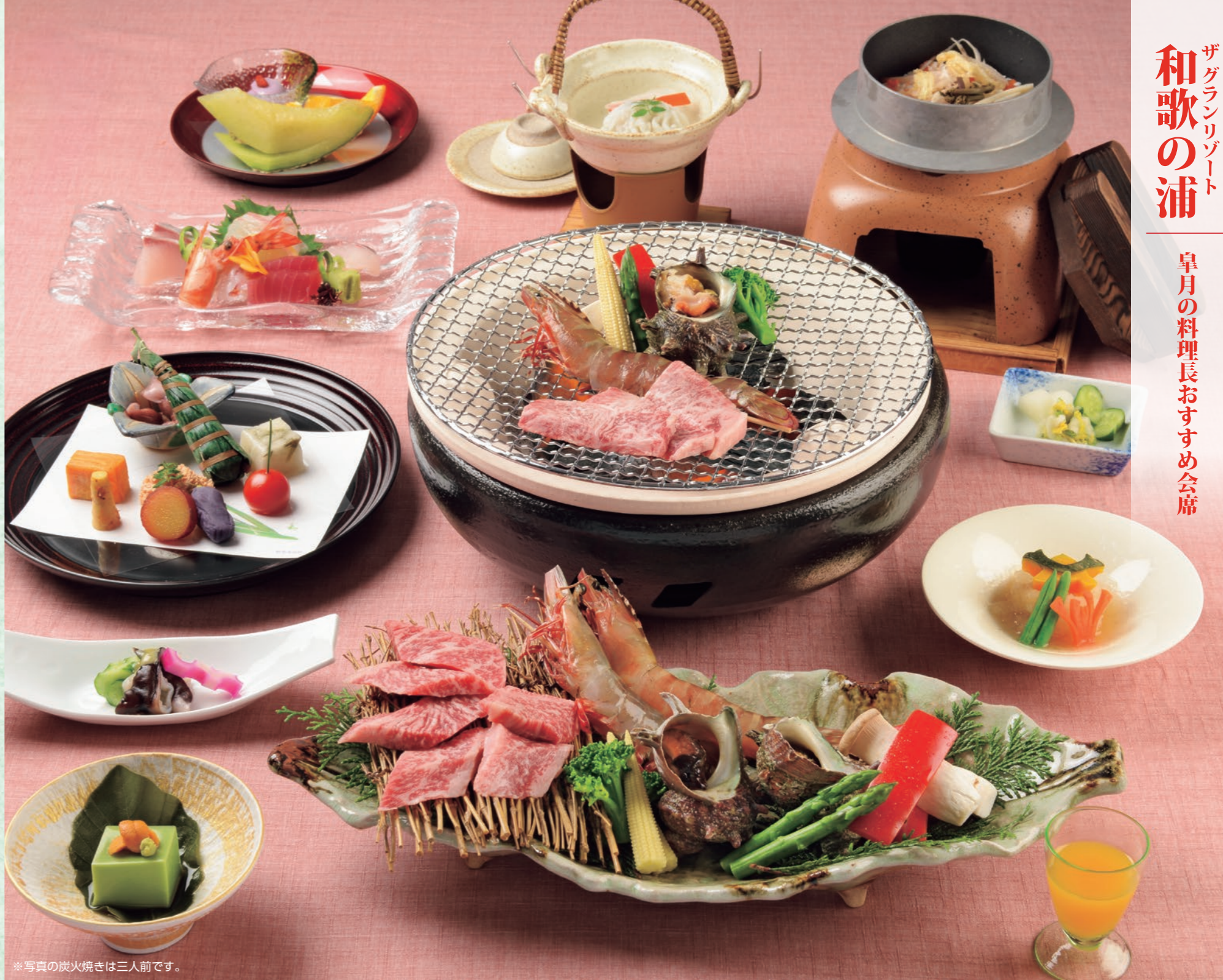
※写真の炭火焼きは三人前です。