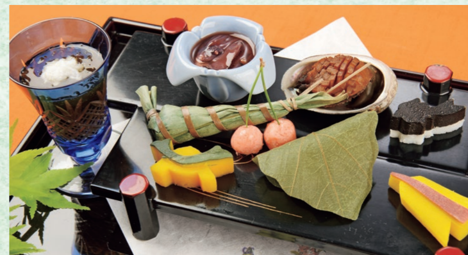
皁月の八寸 兜(かぶと)南京や粽(ちまき)、柏葉寿司など端午の節句をイメージした料理を中心に九種が並びます。