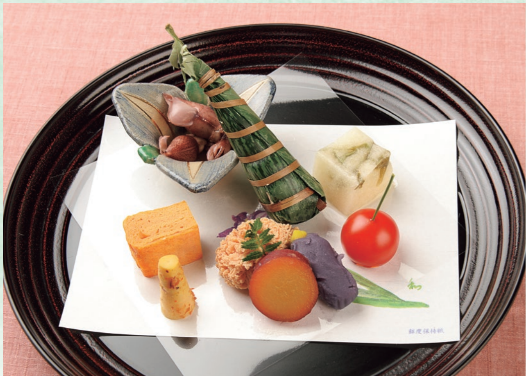
皇月の八寸 煮崩れることなく、しっかりした歯ごたえが楽しめる鯛の卵やホタルイカ、長芋と順才で作った養老、桜桃(さくらんぼ)を模したミニトマトなど、味にも見た目にもこだわっています。