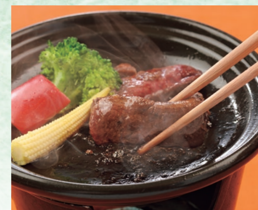
焼き物 黒毛和牛の陶板焼き シンプルな陶板焼きは肉のうまみを最大限引き出します。こだわりの黒毛和牛フィレ肉をお好きな焼き加減でご堪能ください。