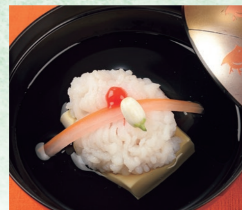
椀 清汁仕立て 鱧葛打ち 鱧を葛打ちしておいしさを閉じ込めました。大根と人参で、端午の節句らしい源平吹き流しを表現。