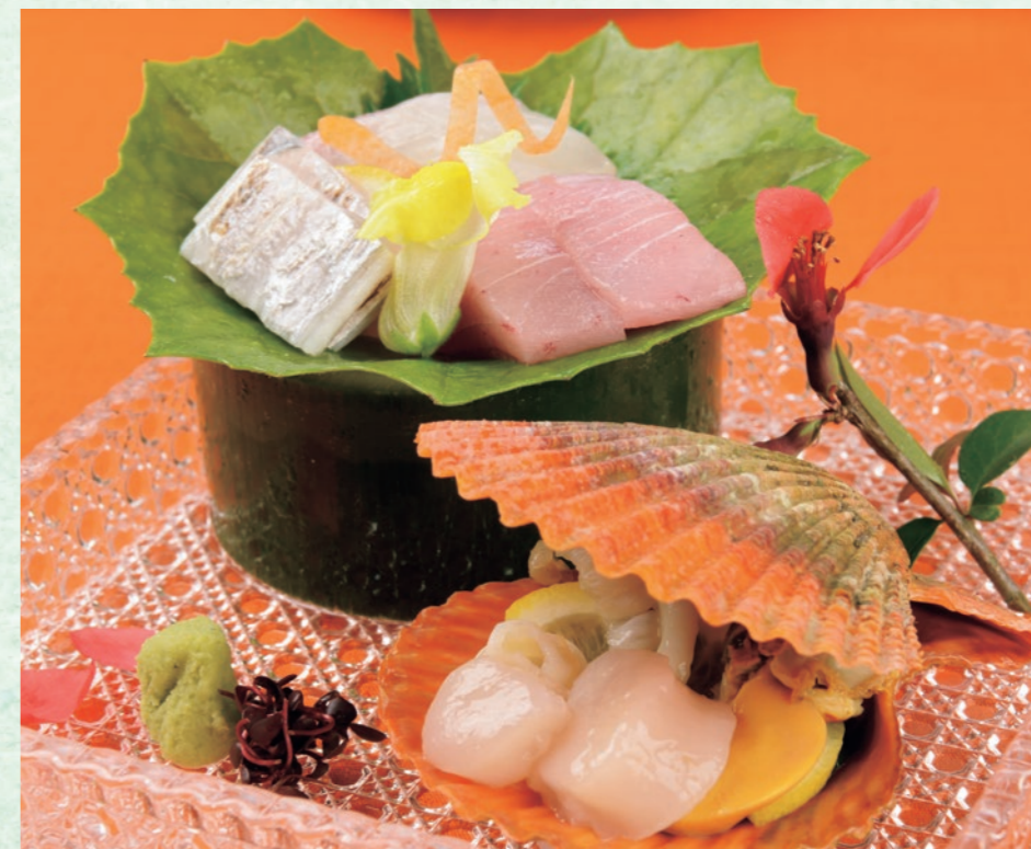
造り 四種盛り合わせ 白浜の魅力は新鮮な海の幸。中でも鮮やかな貝殻のバク貝はプリプリの貝柱が絶品。梅のエキスをエサに配合して育てた梅真鯛のモチモチした食感や太刀魚のコリコリ感も味わい深い。