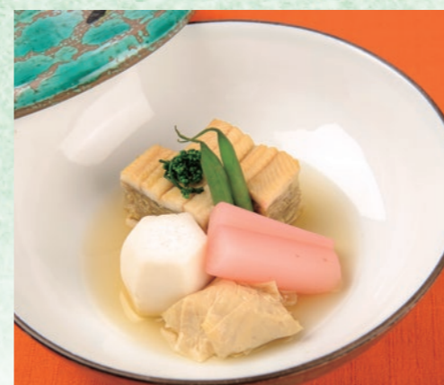
炊き合わせ 穴子柳川寄せ 新牛蒡を笹がきにして穴子とともに柳川寄せに。旬の独活(うど)の香梅煮や小芋とともに華やかな逸品です。

造りのネタは、提供日当日に一番良質な魚介を仕入れております。内容が異なる場合がございますので、ご了承ください。