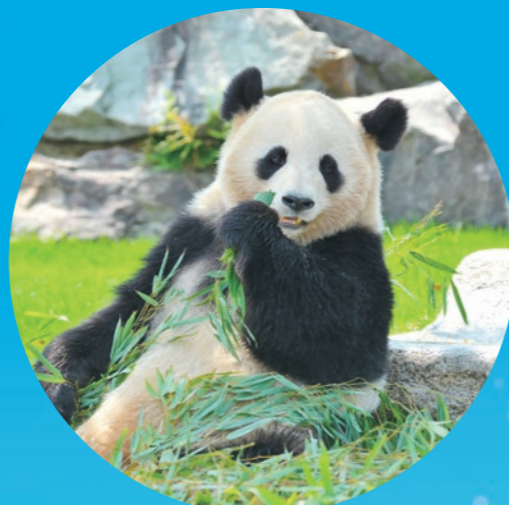
アドベンチャーワールド