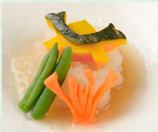
炊き合わせ クエのみぞれ煮 越冬するために上品な脂をたっぷり蓄えたクエは淡泊ながらも奥深い味わい。