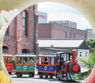
フラワー・ロードトレイン (洲本市中心市街地)

花いっぱい 淡路島で遊ぼう！ ジャパンフローラ2000から15年、淡路島を舞台に再び花の祭典「淡路花博2015花みどりフェア」が開催されます。この春はぜひ淡路島で華やかな楽しいイベントを思い切り満喫しましょう！