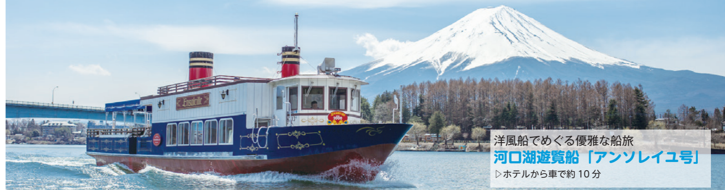
洋風船でめぐる優雅な船旅 河口湖遊覧船「アンソレイユ号」 ▷ホテルから車で約10分

雪化粧をした壮麗な富士山を見るなら今がお勧め!山上や湖から眺めれば、陸とはまた違った絶景を楽しめますよ。