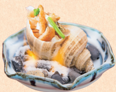
バイガイつぼ焼き お一人様1,080円(税込) 手のひら大の貝に煮たバイガイの身を入れ、アルコールの火でさっとひとあぶり。目の前の炎と磯の香りがなんとも心憎い演出。