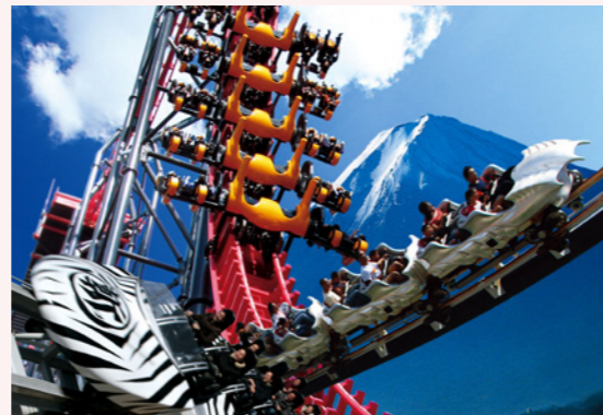
© 2013 Anne Gutman & Georg Hallensleben / Hachette Livre