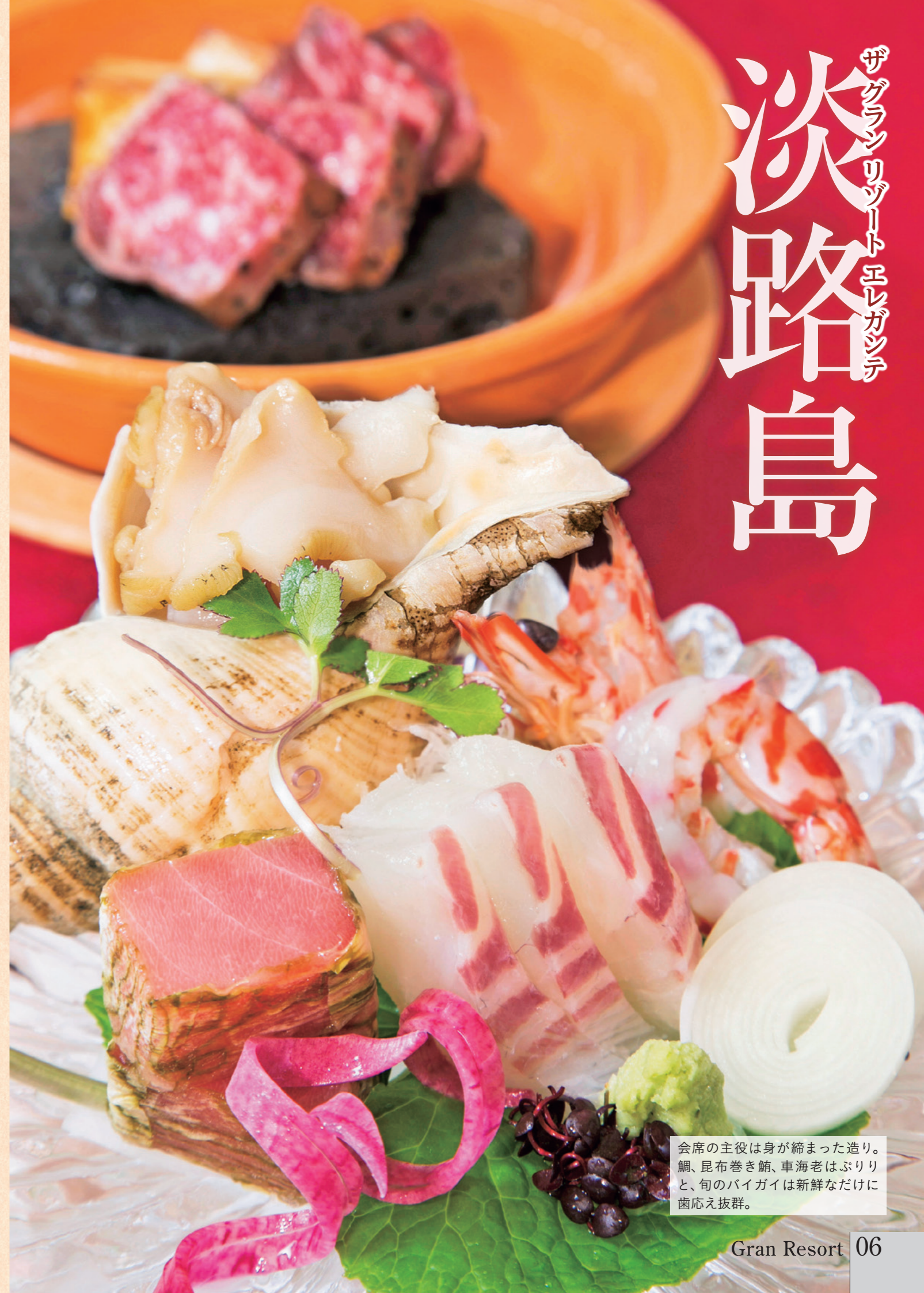
会席の主役は身が締まった造り。鯛、昆布巻き鮓、車海老はふりりと、旬のバイガイは新鮮なだけに歯応え抜群。