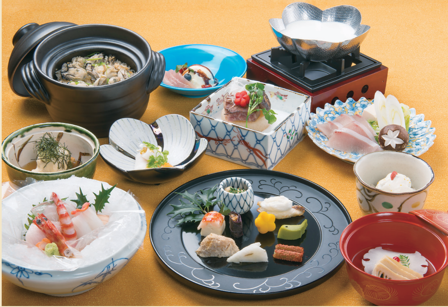
プリンセス富士河口湖 40周年記念会席