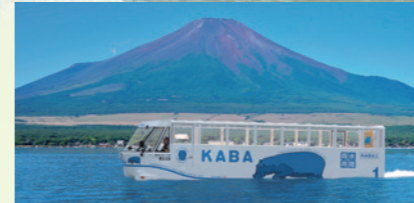
陸上&水上も自由自在 水陸両用バス 「YAMANAKAKO NO KABA」 ▷ホテルから車で約20分

雪化粧をした壮麗な富士山を見るなら今がお勧め!山上や湖から眺めれば、陸とはまた違った絶景を楽しめますよ。