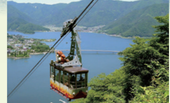
富士山、河口湖の大パノラマ 天上山公園 カチカチ山ロープウェイ ▷ホテルから車で約8分