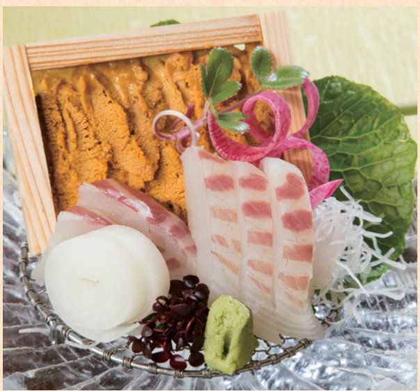
由良ウニと鯛会席 お一人様 +4,320円(税込) 4月からは淡路島を代表する春の食材、由良ウニと鯛を贅沢に使った人気会席をご用意。ぜひご賞味ください。