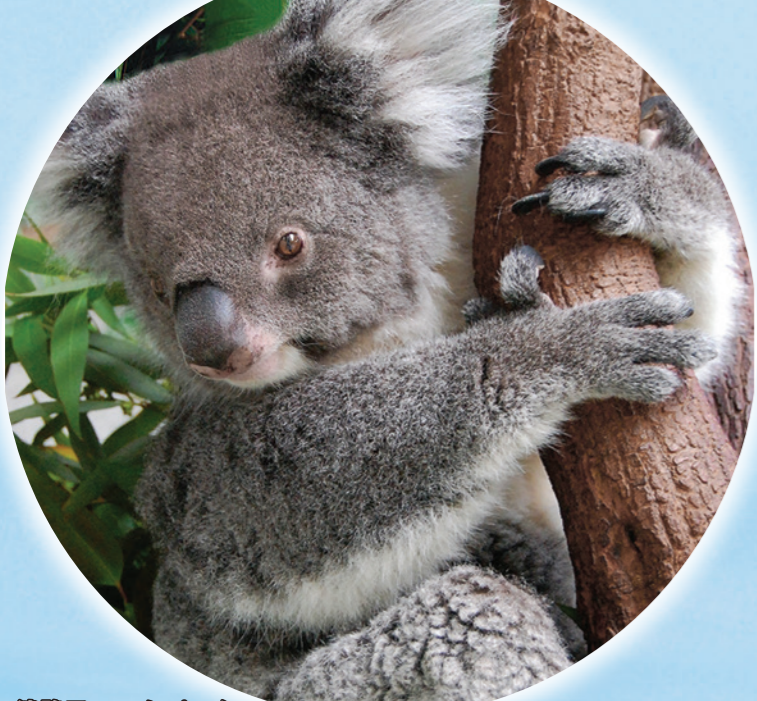
淡路ファームパーク イングランドの丘