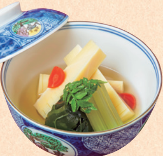
若竹煮 お一人様1,080円(税込) 提供期間：3月1日～5月中旬。 さくさくと歯応えが小気味良い筍と、ワカメとの取り合わせが絶妙。優しい味わいが染み込んでいます。

ひろうすの焼き合わせと、甘鯛木の芽焼きにはどちらも筍が使われ、柔らかな口どけから爽やかな春の香気が広がります。熱した石に載せられ供される淡路牛は、ほとぼしる旨みの力強さを熱々のうちに最後の一切れまで堪能していただけます。