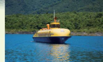
船底窓から生き物を観察 本栖湖遊覧船「もぐらん」 ▷ホテルから車で約30分