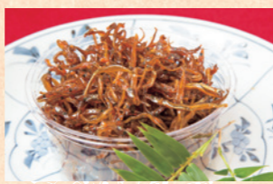
料理長特製いかなご釘煮 648円(税込) 売店にて販売 料理長特製の釘煮は走りのいかなごを使っており、小さいけれど口当たりよくまろやか。淡路島名物をぜひおみやげ用に。