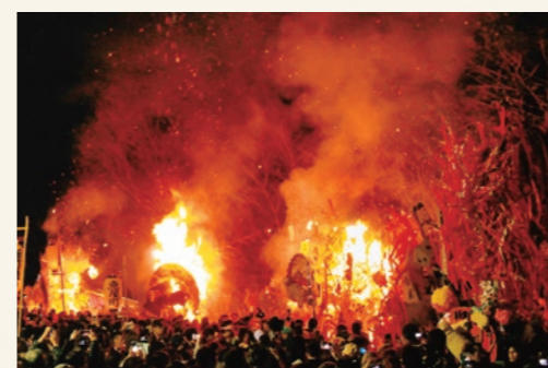
飾り立てられた山車は、すべて手作り。国選択無形民俗文化財に選定。午後8時頃から境内で順次奉火され、祭はクライマックスを迎えます。

期間:3月16日(土)・17日(日) 場所:日牟禮八幡宮(滋賀県近江八幡市内町257) GR近江舞子から車で約20分