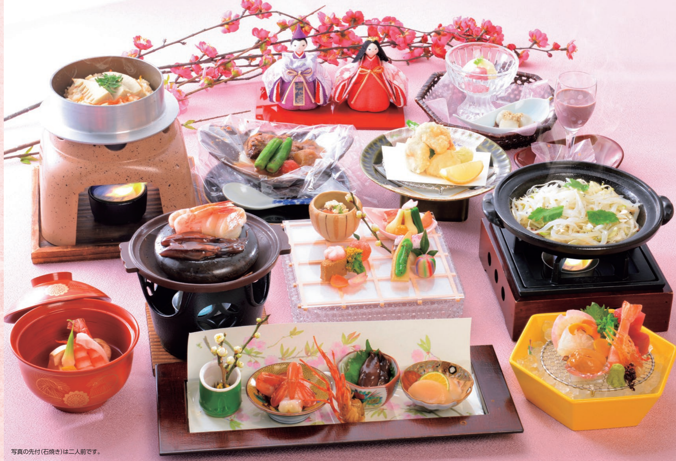
写真の先付(石焼き)は二人前です。