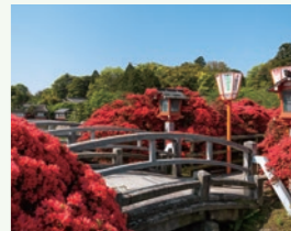
長岡天満宮 霧島つつじ

約120mの藤棚がある鳥羽水環境保全センター、樹齢130年の霧島つつじがある長岡天満宮、約2千株の牡丹が咲く乙訓寺などを巡ります。 実施日 4月27日(土) (前日・当日ご宿泊の方で希望者対象) 参加費 お一人様 15,000円(税込) 募集人員 16名様(最少催行人員/6名様)