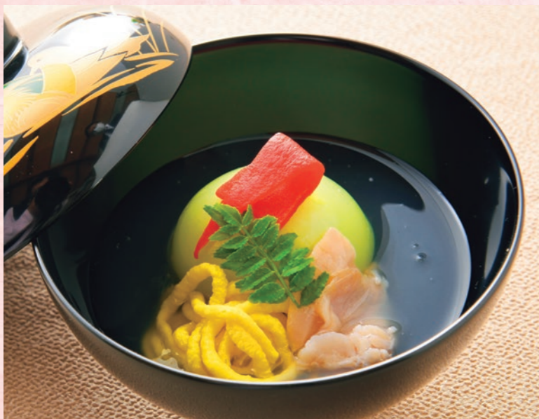
椀物 薄葛仕立て 若草豆腐 うすい豆で作った若草豆腐に蛤、黄身素麺を添えて。薄葛の出汁はとろりとした飲み口で優しい味わい。