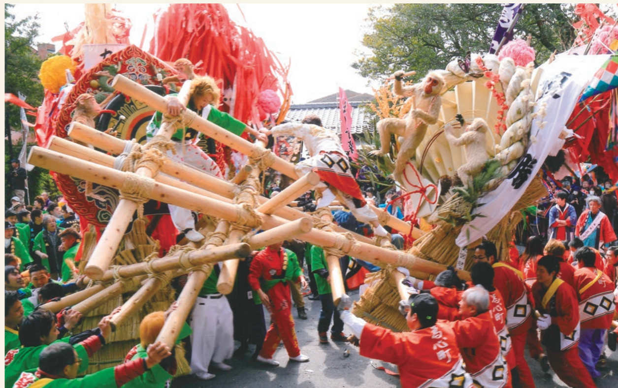
湖国に春を告げる「ケンカ」の熱気 左義長まつり 【滋賀県近江八幡市】