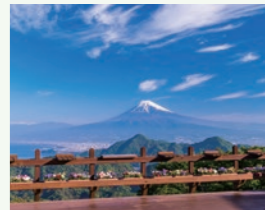
伊豆の国パノラマパーク

伊豆パノラマパークの名所「富士見テラス」での富士山見物、修善寺で散策をお楽しみいただけます。 実施日 3月20日(水) (当日ご宿泊の方で希望者対象) 時間 9:00 ホテル出発 参加費 お一人様 10,800円(税込) 募集人員 20名様(最少催行人員/10名様)