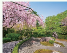
退蔵院の枝垂れ桜

妙心寺の塔頭「退蔵院」で精進料理を召し上がっていただき、平安神宮のライトアップをご覧いただくツアーです。精進料理はミシュラン一つ星の「阿じろ」で、春の特別メニューをご用意します。 実施日 4月4日(木) (当日ご宿泊の方で希望者対象) 参加費 お一人様 11,000円(税込) 募集人員 16名様(最少催行人員/6名様)