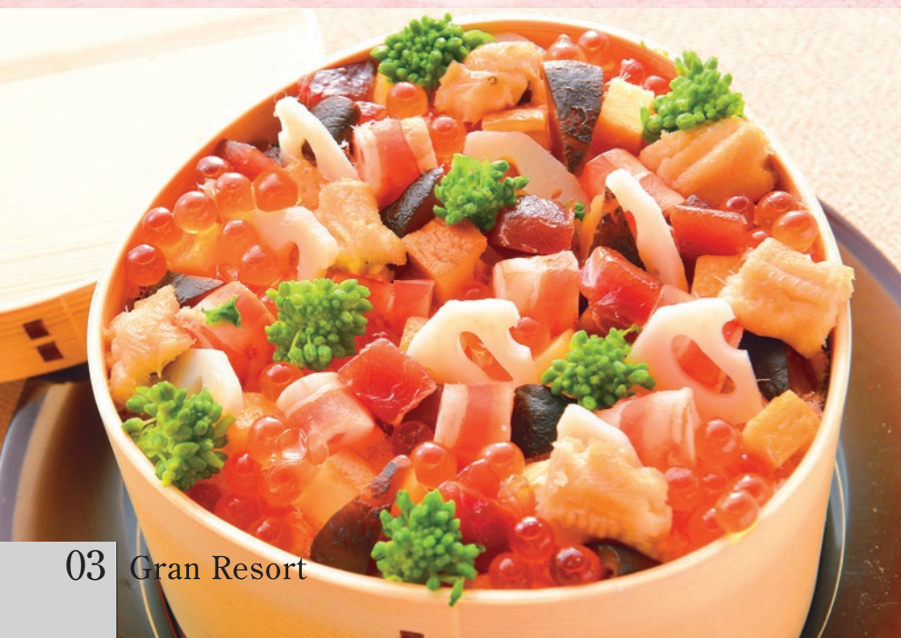
食事 ちらし寿司 雛祭りにちなんだ一品。穴子、イクラなど具材がたっぷり。