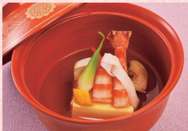
椀物 清汁仕立て 才巻海老 玉子豆腐 雛祭りをイメージし、玉子豆腐はひし形に、彩りは華やかに美しく。