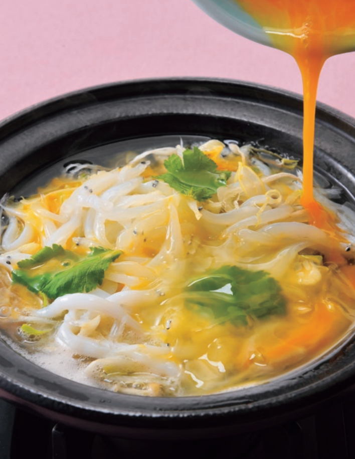
鍋物 白魚鍋玉締め 卵をかけて、ふっくらと仕上げ召し上がっていただきます。山椒をお好みで。