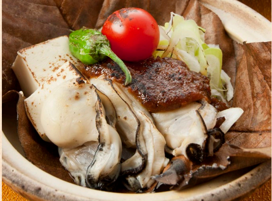
カキ朴葉味噌焼き

理を存分に召し上がっていただけます。蒸し焼きカキは、シンプルな調理だけにカキ本来のふっくらとした身と風味をストレートに味わえる一品。カキフライはサクツと身はジューシー。さらに土瓶蒸し、鍋物、炊き込みご飯と、カキ好きにはたまらない豪華な献立がそろいます。