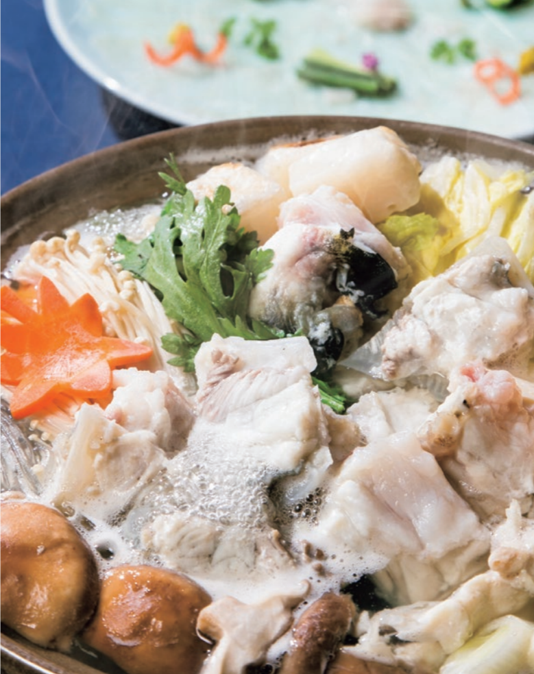
ふぐ鍋 ぐつぐつと煮えたつ鍋にふぐの大きな身がおどります。濃厚なふぐの身と野菜の味が絶妙に重なり合った出汁でいただく雑炊も美味。

さらに唐揚げ、白子焼き、ふぐ皮の湯引き、熏り豊かなひれ酒と、めくるめくふぐ尽くしの宴を存分に堪能ください。