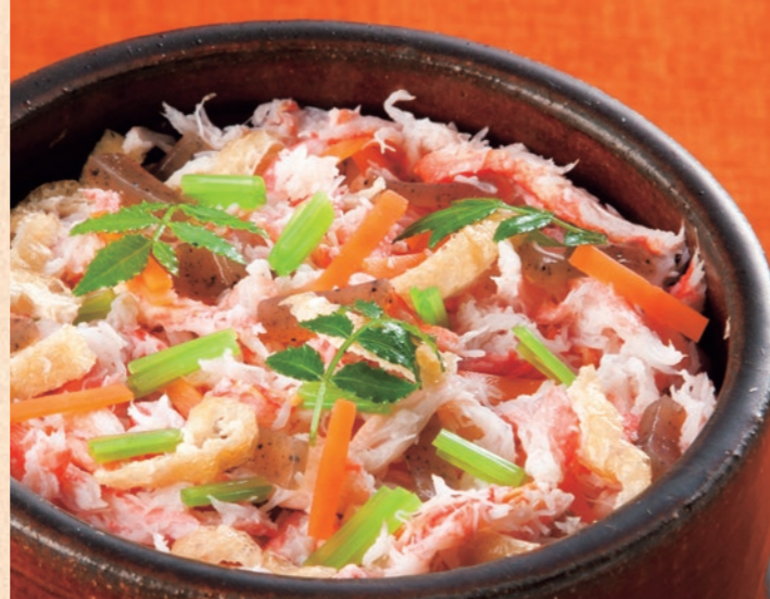
カニ釜飯 ほくした身を入れふっくら炊き上げたご飯はカニのうまみと香りが染み込み、噛むほどに口の中に広がっていきます。

ザグランリゾートが誇る冬の名物カニ会席が、いよいよ11月6日から始まります。身が詰まった厳選カニをふんだんに使った料理は、一度食べたなら忘れられないほどの贅沢さ。まもなく訪れるクリスマスや忘年会など大勢で集まる宴に味わえば、舌も心も大満足。他では味わえないカニ三昧をザグランリゾートでたっぷりお楽しみください。 カニ料理の基本は造り、焼き、蒸し、鍋の4種類。プリッとした食感から甘味が広がる造り、うまみがぎゅっと凝縮された焼き、本来の風味が引き立つ蒸し、カニのエキスと野菜の出汁が絶妙に合わさった鍋。食べ進むごとに多彩な味わいが広がっていきます。さくっと香ばしいジューシーな揚げ物、濃厚なカニ味噌をカニ身に絡めて食す甲羅焼きも魅力。さらにホテルごとに料理長が腕によりをかけたオリジナル料理を用意。訪れる楽しみが尽きません。