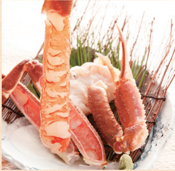
カニ造り ぶりぶりとした食感の身を口を含むと、みずみずしくほのかな甘味がふわり。一本、また一本…おいしさに手が伸びます。