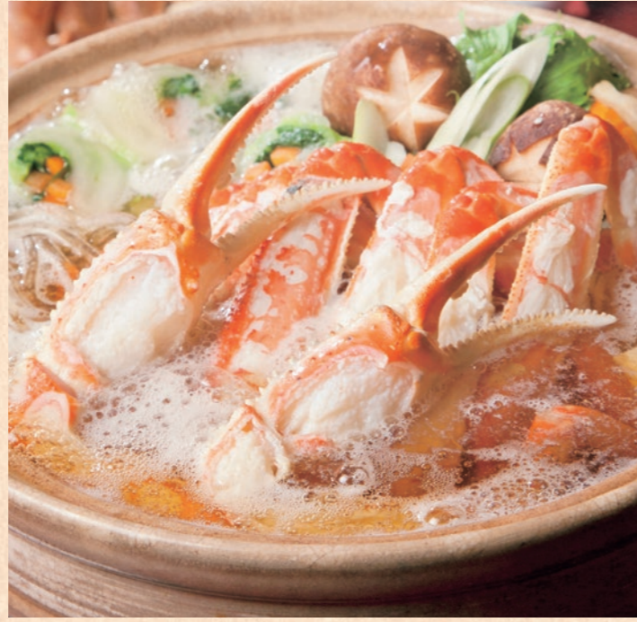
カニ鍋 熱々のカニにふうふうと息を吹きかけ頬張れば、体もぼかぼか。締め雑炊まで格別の美味しさ。