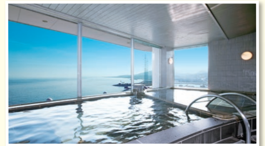
GRE 淡路島 温泉大浴場