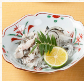
ふぐ皮湯引き コリコリとした皮には上質のコラーゲンたっぷり。淡泊さの中に深いコクがあり、噛むほどに旨味がじわり。