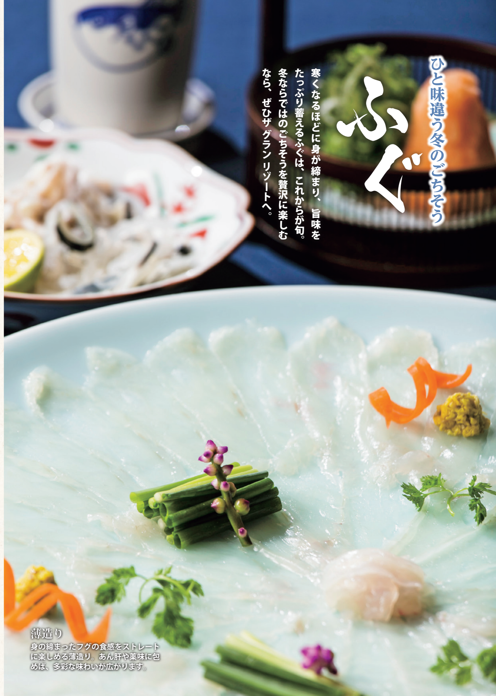
薄造り 身の締まったフグの食感をストレートに楽しめる薄造り。あん肝や薬味に包めば、多彩な味わいが広がります。

ひと味違う冬のごちそう ふぐ 寒くなるほどに身が締まり、旨味をたっぷり蓄えるふぐは、これからの旬。冬ならではの「ごちそう」を贅沢に楽しむなら、ぜひザグランリゾートへ。