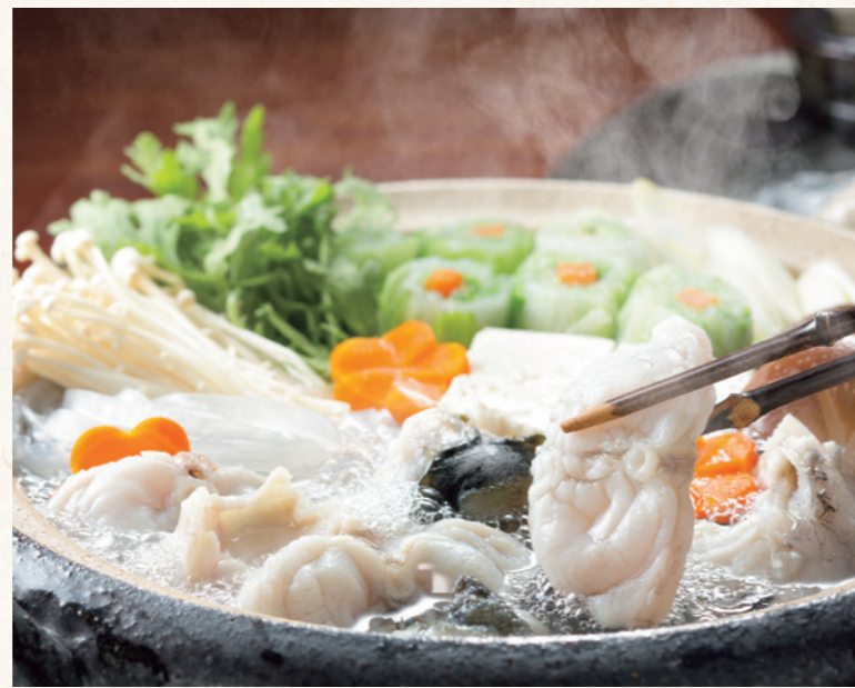
ふぐ鍋 ぐつぐつと煮えたつ鍋にふぐの大きな身が踊る。濃厚なふぐの身と野菜の味が絶妙に重なり合った出汁でいただく雑炊も美味。

ひと味違うこだわりのふぐをいただけるのが、GRE 淡路島の「福良産ふぐ」※とGRE 三方五湖の「若狭ふぐ」。いずれも良質な環境で育てられた最高品質のとらふぐで、ここでしか味わえない絶品料理を求め、毎年多くのお客様でにぎわいます。