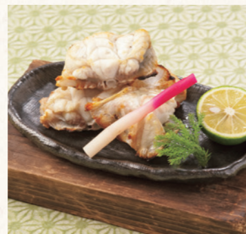
焼きふぐ 外はカリッと香ばしく、中身はジュシー。鉄板から立ち上る香りに食欲がそそられます。(特別ふぐ会席のみのご提供)