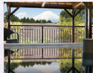
プリンセス富士河口湖