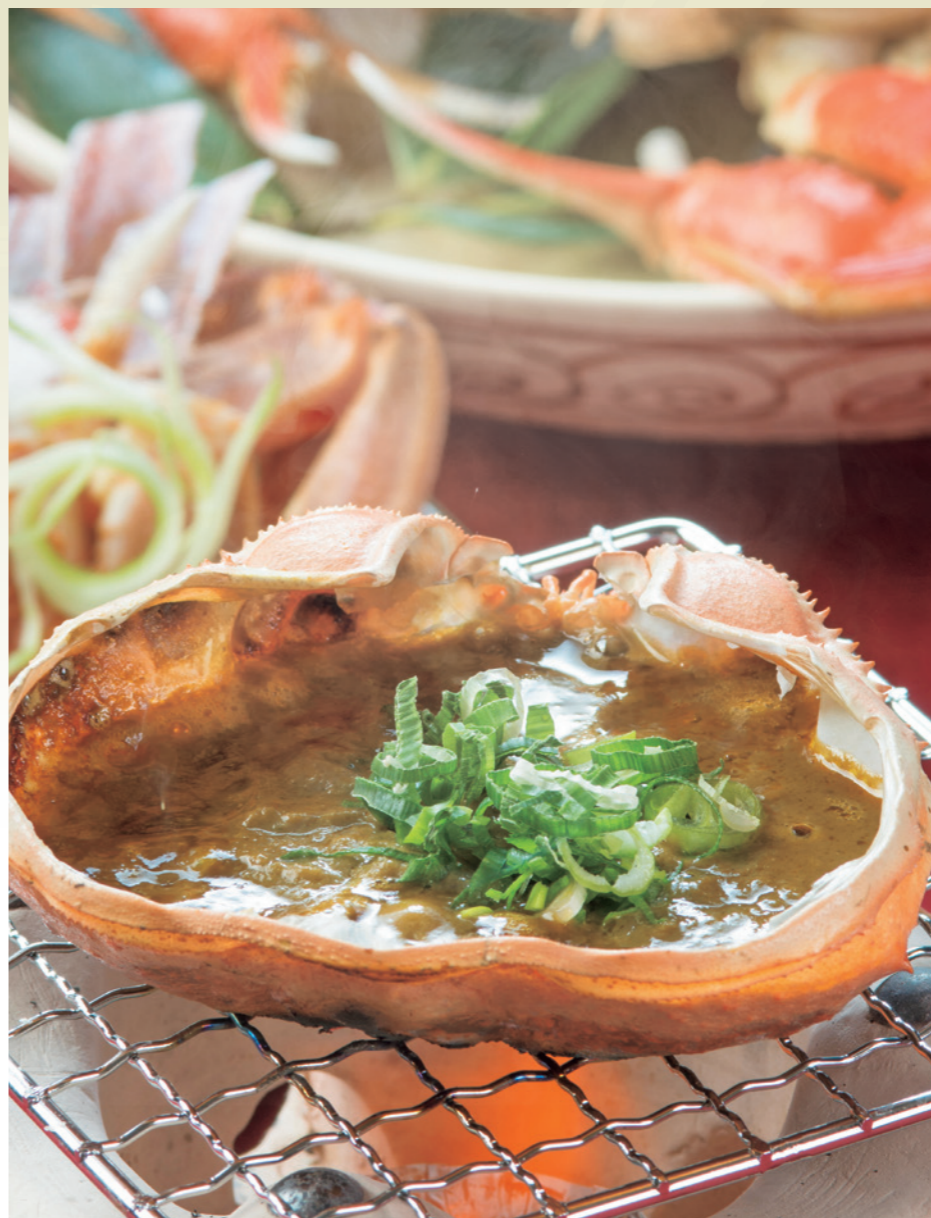
カニ甲羅焼き 山陰特産のベニガニとズワイガニのカニ味噌をブレンドし、深みのあるコクを生みだしています。日本酒を甲羅に注ぎ飲めば、濃厚な味噌と絡み合い、お酒が進みます。