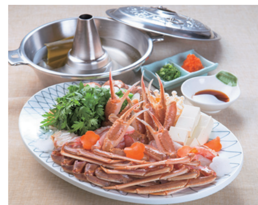
カニしゃぶ ※別注料理 お一人様 3,240円(税込)

歴史情緒漂う温泉街がひと際華やぐ冬、ザグランリゾート城崎では料理長のこだわりが詰まった豪華カニ三昧と、地元で獲れた海鮮で皆様をおもてなしいたします。 自慢の会席料理の中でおすすめは焼きカニ。繊細なカニの風味を引き出すため、味付けに天塩という沖縄産の甘味を含んだ塩を使用。みっちりとした身の詰まったカニを豪快にほおげれば、カニ本来の旨味と甘味がたちまち広がり、〱口福感に包まれます。 オニエビやハタハタなど日本海で獲れた旬の地魚もご用意していますので、会席に加えて、この機会にぜひ味わってください。