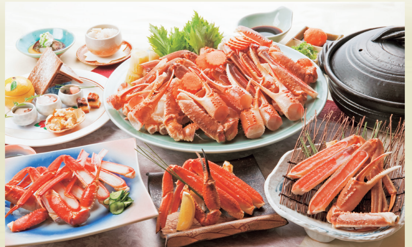
竹カニ会席 +3,240円追加(税込)