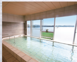
GR 天の橋立 (2013年改装済)

寒くなるこれからの季節、カニやフグ料理と合わせて温泉でほっこりと温まりませんか。ザグランリゾートには、絶景を望む露天風呂や効能豊かな温泉など多彩な湯浴みを楽しんでいただけます。ぜひ、お越しください。