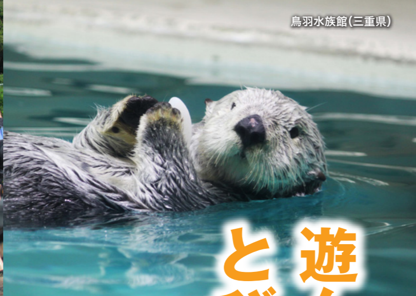
鳥羽水族館(三重県)