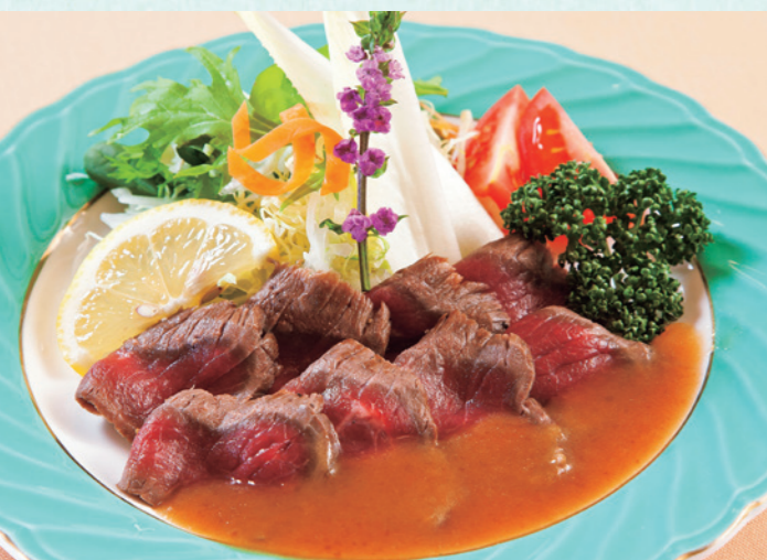
信州牛たたき 2,160円(税込)

鮮やかな紅色の身が食欲をそそる信州サーモンは造りで、柔らかくとろけるような舌触りにほどよい脂の乗り、厚みのある身を噛みしめるほどに清らかで芳醇な旨味が広がっていきます。