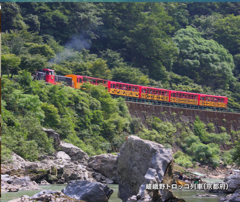
嵯峨野トロッコ列車(京都府)

七夕の夜空、緩やかに流れる天の川に輝くのは、一年に一度の逢瀬を待ち望んだ織姫と彦星。 唐墨 からすみ を加えて練った卵黄でかたどった短冊のそばには、五色の糸を飾り立てています。これは、「乞巧 きこう 奠」という宮中行事にちなんでおり、平安貴族の女性たちは織姫を祭り、五色の糸を祭壇に飾り裁縫など技芸の上達を願っていたといわれています。 また、当時、願い事を書いた梶の葉を水に浮かべ、二つの星を水面に写し折ったという風習から、その雅な情景を透明感のある楓海老冬瓜で表しました。