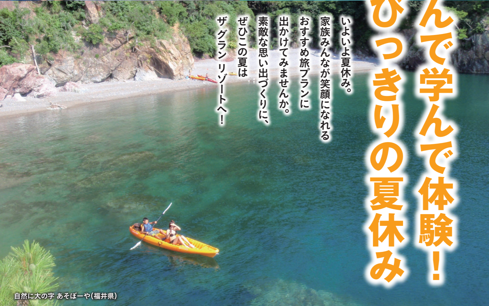
自然に大の字 あそぼーや(福井県)

いよいよ夏休み。 家族みんなが笑顔になれる おすすめ旅プランに 出かけてみませんか。 素敵な思い出づくりに、 ぜひこの夏は ザグランリゾートへ!