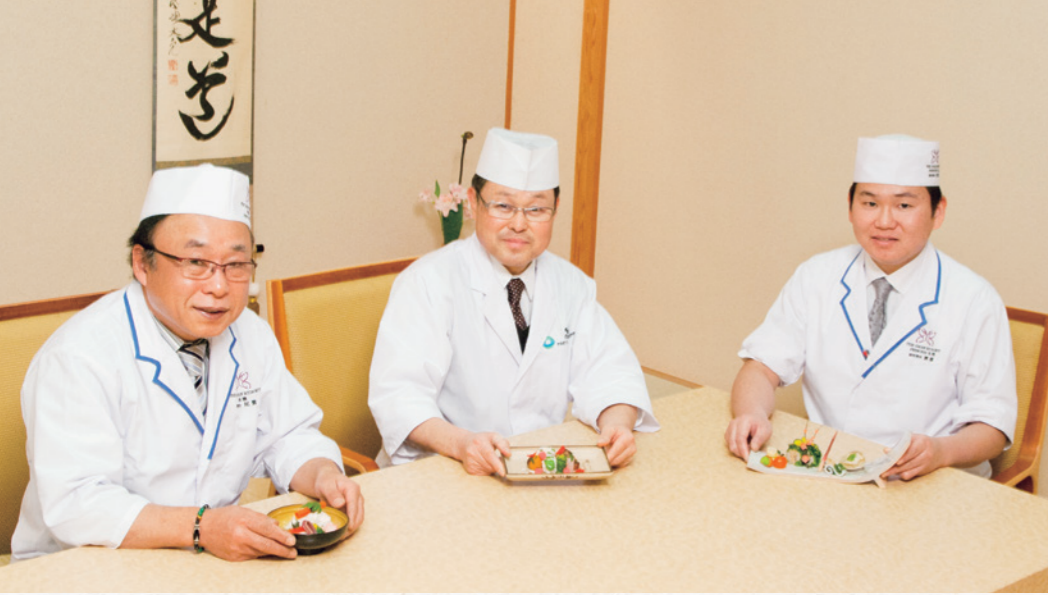
プリンセス有馬にて

います。 椀の一番下に敷いている春大根のかんは、米粉もち米に水分を抜いた大根おろしと長芋を合わせ、ひし餅に見立ててかたどりました。九州の和菓子、かるかんのようにふんわりと柔らかい食感と、大根のしつとりとした風味を楽しんでいただけれます。 小山 春大根のかん、道明寺をかけていただく桜餅風の針魚の白魚包み