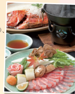
※料理写真はイメージです。

3月31日(月)まで 特別カニ会席(+3,150円)、4月1日(火)～5月31日(土)まで 金目鯛と鮑の特別会席(+3,240円)でお待ちしています。