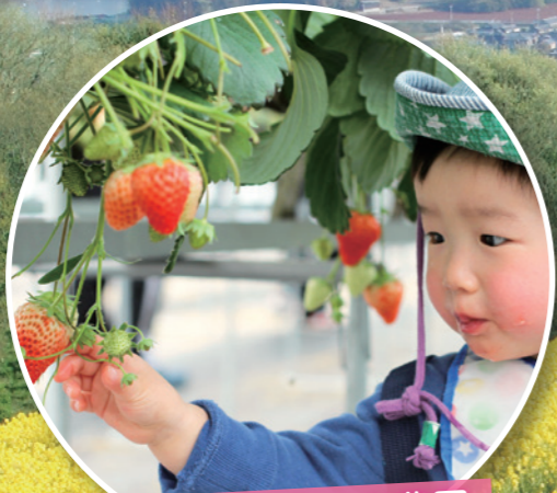
淡路島フルーツ農園