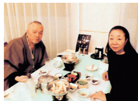
昨年2月に利用したGR葉山にて

また、食事中に支配人をはじめ、スタッフが気さくに話しかけ、和やかな雰囲気作りが料理の味わいをさらに引き立てると言います。お二人とも時間が許