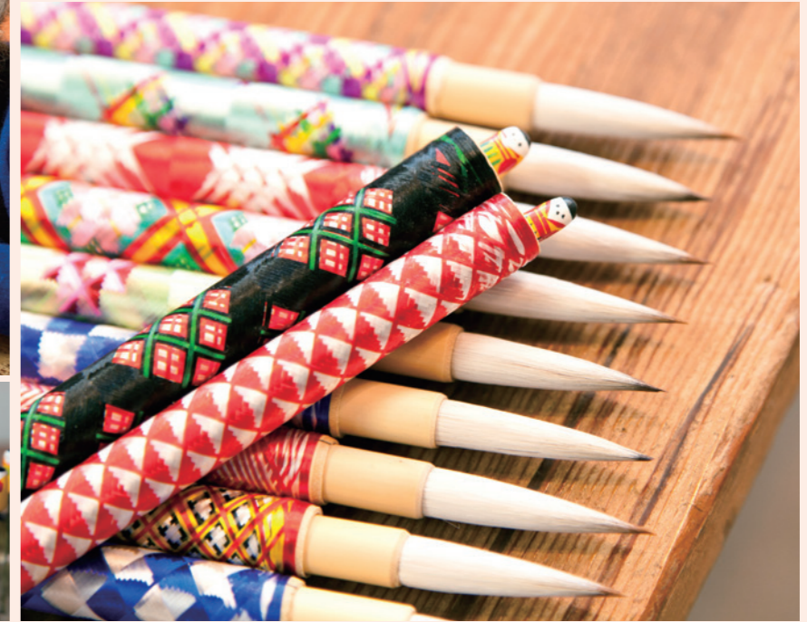
一本1,785円～。小筆とのセット、男女ペアのセットもあります。