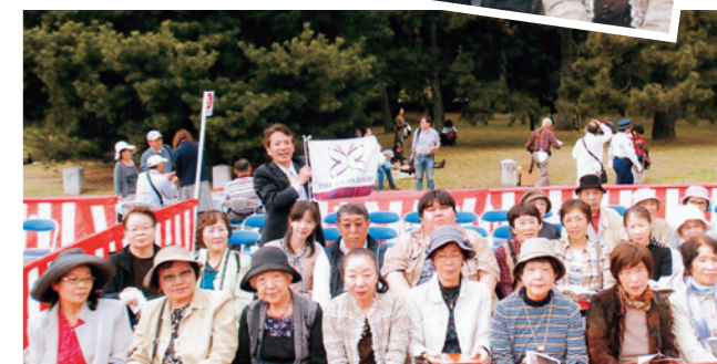
昨年10月、GRE京都主催の「時代祭と特別献立」のイベントに、お母様と詞子様2人で参加しました