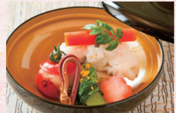
GR赤穂 料理長尾鷲 針魚・白魚・大根・プチトマト・人参・長芋など