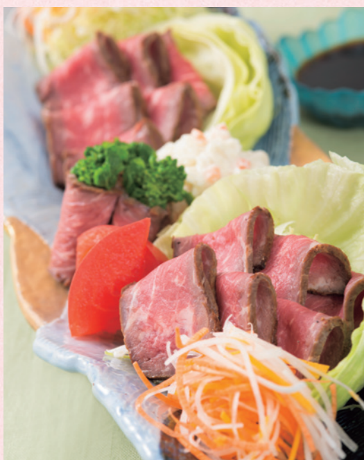
ローストビーフ 2人前2,100円(税込) (4月以降2,160円・税込)

煮物は蕪蒸銀箔かけ、焼き物はメレンゲに白酒を加えた雪洞でまろやかに焼き上げた鱈の達磨焼きとカキの木の芽味噌焼き。白魚の玉締め鍋は、白魚に玉ねぎと白葱の甘味が合わさり、あっさりとしながらも旨味は濃厚です。