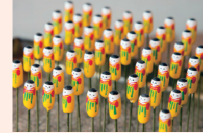
有馬人形筆は、奈良時代、孝徳天皇が有馬温泉滞在中に有間皇子を授かったことにちなんで作られたと言われています。