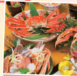
※料理写真はイメージです。

3月31日(月)まで カニ会席、4月11日(金)～10月26日(日)まで 香住産紅ガニ会席(通常料金+2,160円)でお待ちしています。