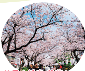
鶴岡八幡宮(段葛(葉山))