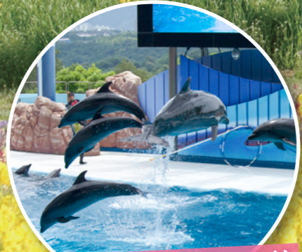
アドベンチャーワールド