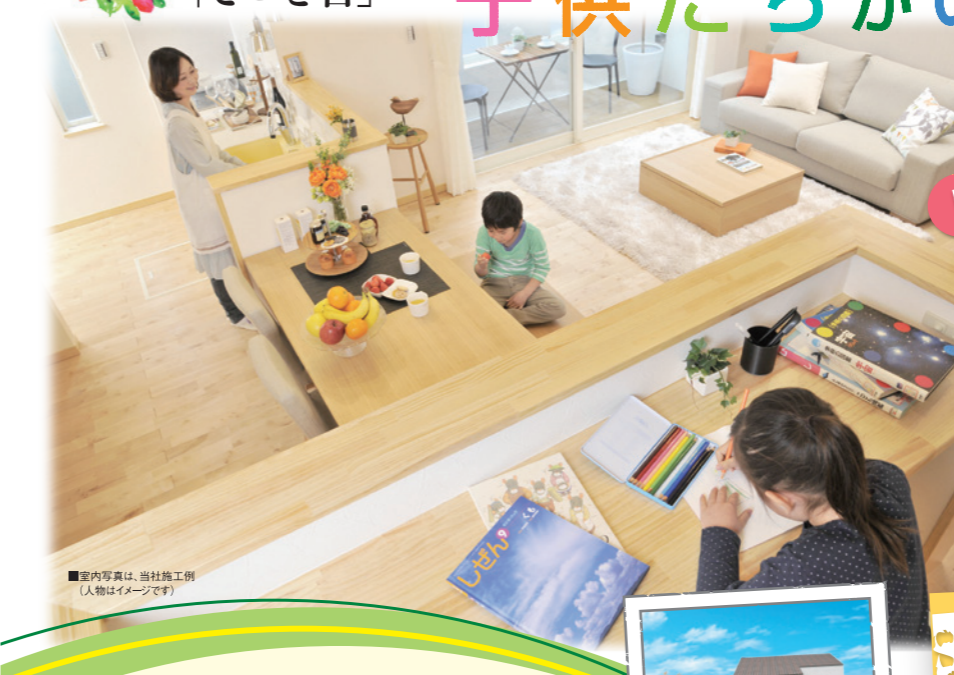
■室内写真は、当社施工例 (人物はイメージです)