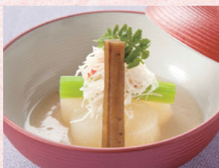
プリンセス有馬 丸大根・ずい蟹・蓴・牛蒡・木の芽など