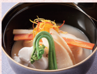
GRE 軽井沢 信濃ユキマス・信州サーモン・大和芋・大根・牛蒡・人参・蕨・里芋・筍など