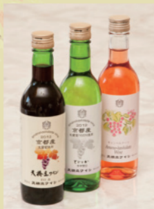
「旅の小箱」のコーナーで紹介した「天橋立ワイナリー」のワイン(赤、白、ロゼ)がホテル内でいただけます。

会席料理と合わせ一品料理もぜひ。左から柔らかく蒸した甘鯛の宝楽焼き(2100円・税込)、濃厚な口当たりの「カニ味噌甲羅焼き」、カリッと香ばしい「カニのてんぷら」いずれも1050円(税込)