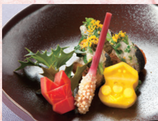
GRE 白浜 鰯・豆腐・卵・菜の花・金時人参・南高梅・サツマイモ・葉地神など

2月中、GRE 軽井沢は通常会席でご提供いたします。プリンセス有馬は1,575円(税込)、GRE 白浜は2,100円(税込、2月20日(木)まで)で一品料理としてご用意いたしますので、ぜひご予約時にお申込みください。