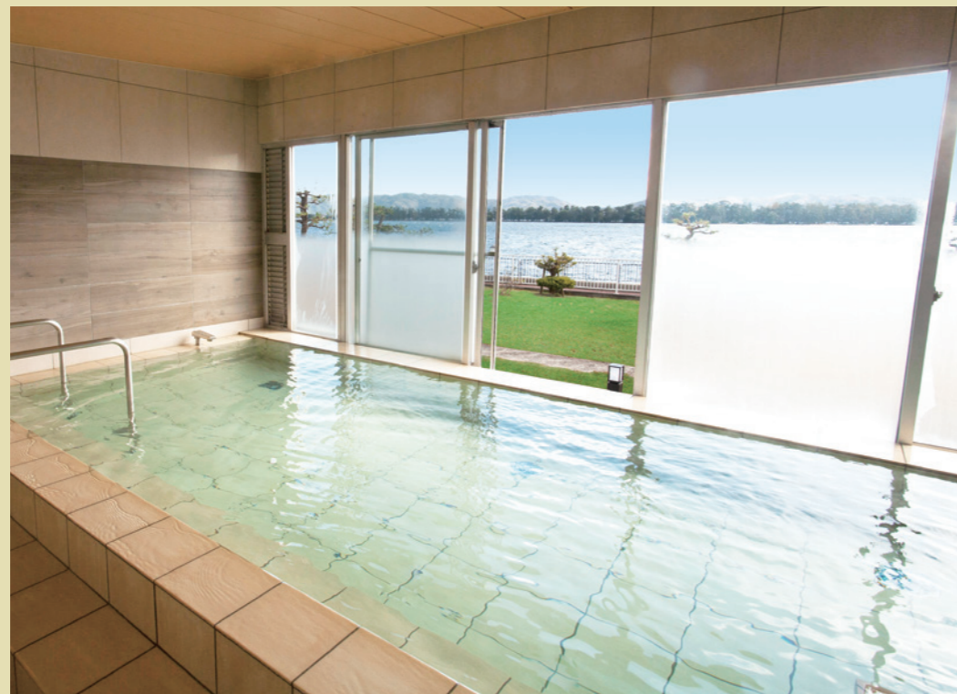
リニューアルにより浴槽が拡張。ご家族でゆったりと湯浴みを楽しめます。

刺身、焼き、蒸し、鍋とバラエティに富んだカニ料理を堪能できる当ホテル一番人気の会席。