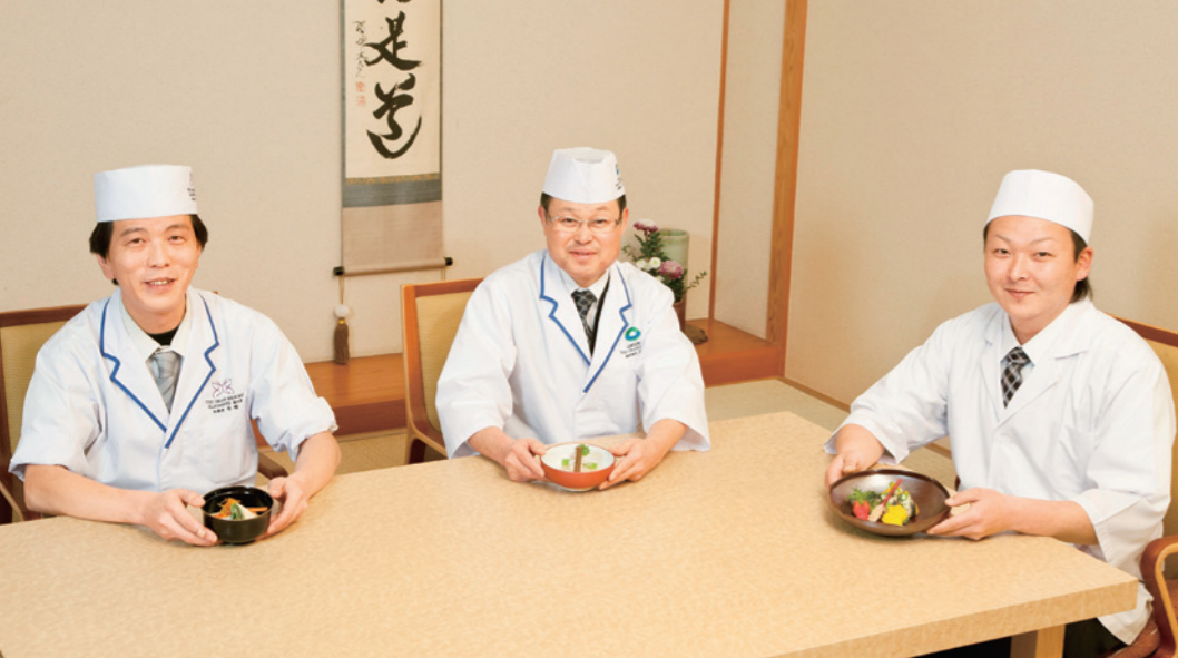
プリンセス有馬にて

えた水でゆがいた筍と共に土佐煮にしています。人参、牛蒡は八方出汁で煮て、蕨は塩ゆでした後、八方出汁に漬けました。出汁を張ったお椀に真薯を注ぎこみ、里芋、筍、蕨などの具材を形よく盛り付けました。 小山 2種類の魚を一度に味わえると、は贅沢です。肉厚で脂の乗った信州サーモンは美味しく、当ホテルでも何度かお