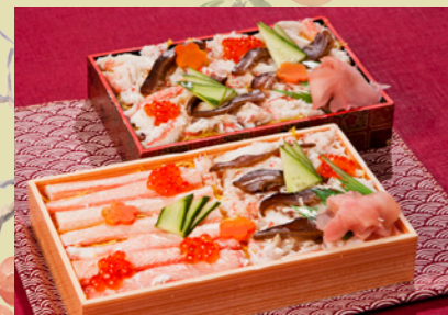
カニ身をたっぷり使った料理長手製のカニ寿司(手前1,575円、奥840円)。ぜひお土産にお買い求めください。