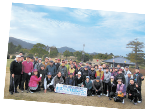
昨年12月17日に行われた第17回忘年ゴルフコンペ

昨年、ザグランリゾートが主催した計12回のゴルフコンペにすべて参加し、見事「皆勤賞」に輝いた4組の会員の皆様。ゴルフを通じて長年親交を深めてこられ、「皆勤賞は仲間のおかげ。今年も元気に仲よく皆勤をめざしたい!」と、いきいきとした笑顔を見せていました。