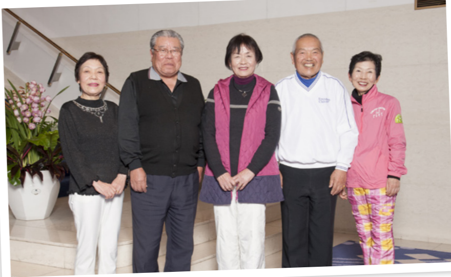
プリンセス有馬にて

ゴルフコンペに参加して4年程、今回で3回目の皆勤賞をいただくことができ、うれしく思います。女性一人でも気兼ねなく参加ができるのは、他の会員の皆様が優しくフォローしてくださるからこそ。とても感謝しています。いろいろなゴルフ場に行きましたが、印象的だったのは富士山を眺めながらのプレーです。とても美しく、遠くまで行った甲斐がありました。その土地の景色の中でプレーできることも、参加する楽しみのひとつになっています。