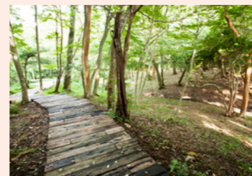
1周約700mある遊歩道。耳を澄ませば野鳥のさえずりが聞こえてきます。