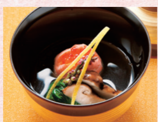
プリンセス有馬 総料理長小山 鮭・イクラ・百合根・小芋・松茸・蔓紫・柚子など