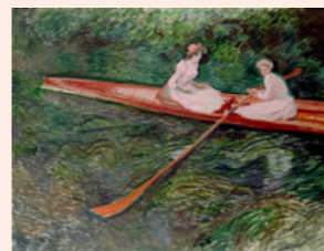
クロード・モネ 《バラ色のボート》1900年 ポーラ美術館蔵

水面に映る女性の影が描かれている上の作品から、3年後に発表されたのが下の作品。水中に揺れる水草が細かく描かれ、掘り下げられたモネの視点を見ることができます。