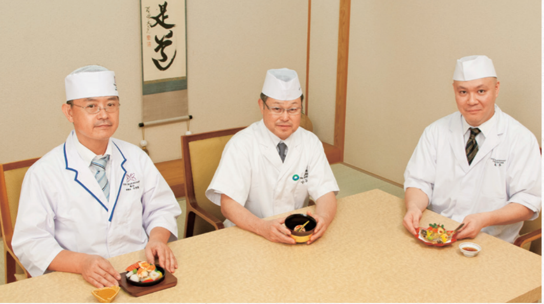
プリンセス有馬にて

す。熱々の鉄板でお客様に提供し、食べる直前にソースをかけて召し上がっていただきます。