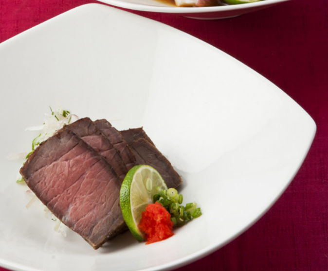
料理写真はイメージです。