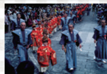
日光フォトコンテスト入賞作品

栃木県日光市山内2301 0288-54-0560 拝観時間 / 8:00 ~ 16:00(季節により変わります) 拝観料(日光東照宮単独拝観券) / 大人・高校生1,300円、小・中学生450円