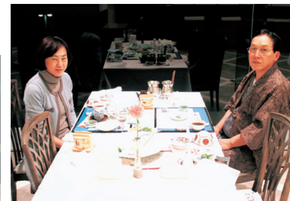
GRE淡路島で剛さんの誕生日を祝いました。