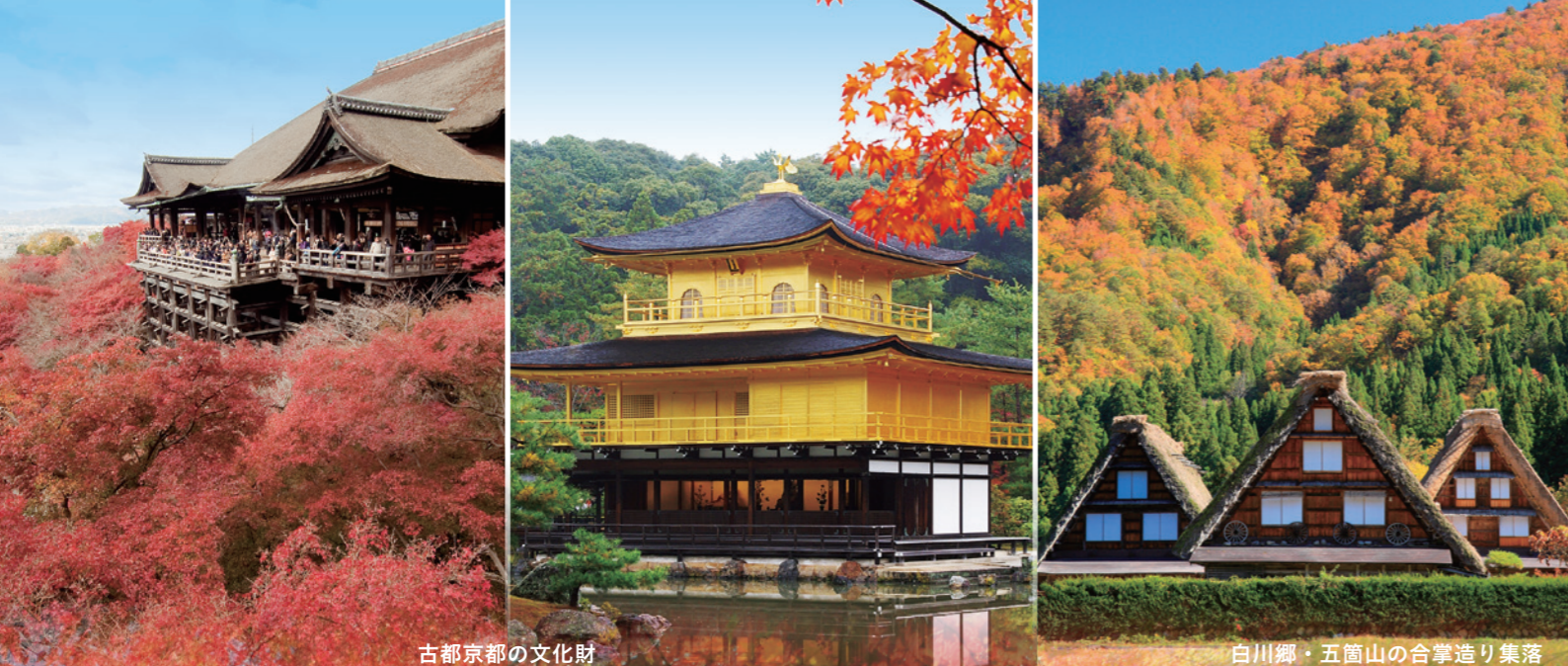
古都京都の文化財