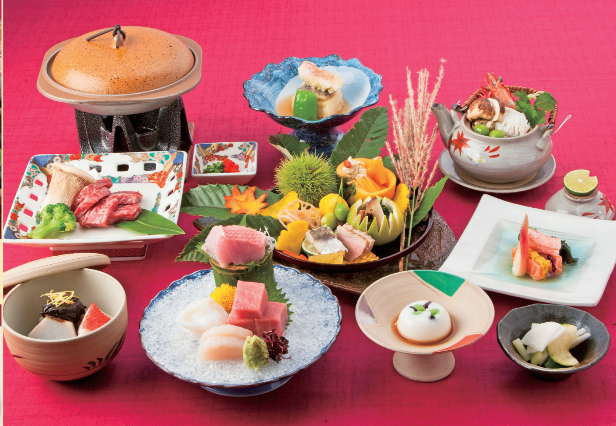
美しく色づく箱根の秋景色にちなみ、金目鯛、足柄牛など多彩な味覚を使い華やかに仕上げた。