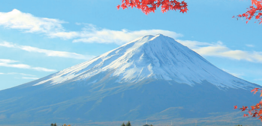
富士山—信仰の対象と芸術の源泉

ザグラン リゾートから足を延ばせば、富士山をはじめ、京都の仏閣、日光東照宮など世界遺産に出会えることができます。紅葉で華やぐ秋、数多の人々に守り継がれてきた悠久の美を味わいに出かけてみませんか。