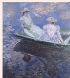
クロード・モネ 《舟遊び》1887年 国立西洋美術館蔵 松方コレクション

ザグラン リゾートから足を延ばせば、富士山をはじめ、京都の仏閣、日光東照宮など世界遺産に出会えることができます。紅葉で華やぐ秋、数多の人々に守り継がれてきた悠久の美を味わいに出かけてみませんか。