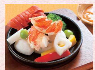
GR葉山 伊勢海老・パプリカ・小芋・蓮根・ブロッコリー・銀杏など