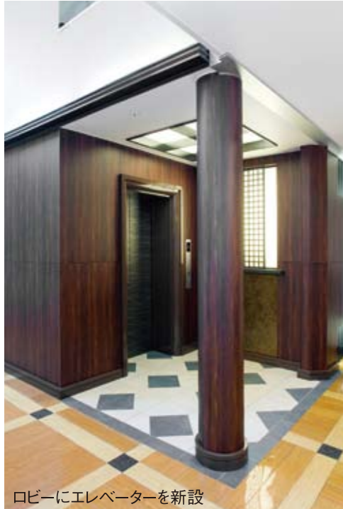
ロビーにエレベーターを新設