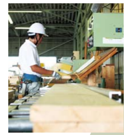
機械による加工のため、品質にばらつきが少なくなります。