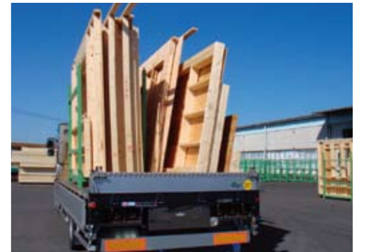
パネル化により現場での工期短縮を計り劣化を防ぎます。