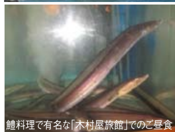
鯉料理で有名な「木村屋旅館」でのご昼食