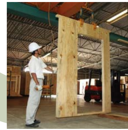
各部材用にカットおよび加工した部品を組み立てて、住宅の壁パネル等を製作します。