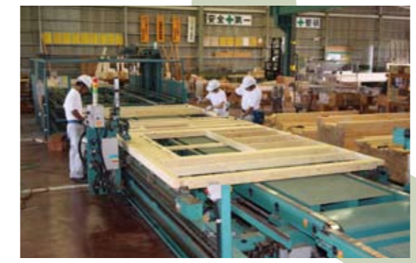
部品を組み立ててパネルをつくります。