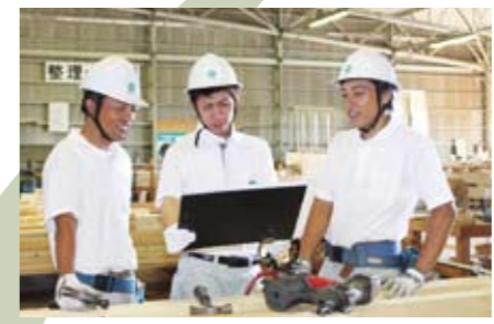
打ち合わせを徹底し、共通の認識のもと作業を開始します。