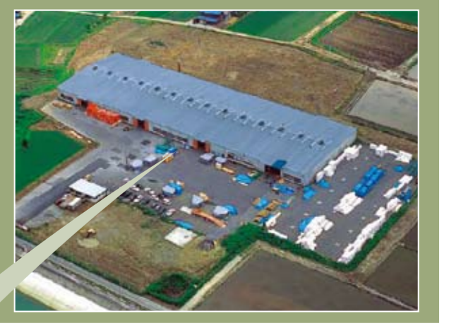
自社プレカット工場