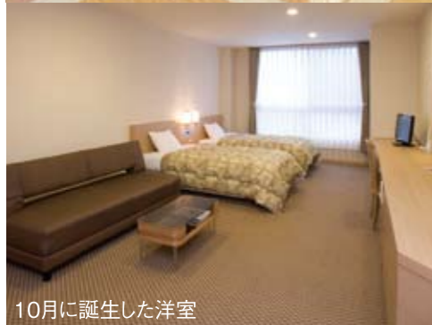
10月に誕生した洋室