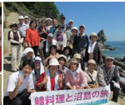
「鯉料理」をじっくりと堪能いただきました。