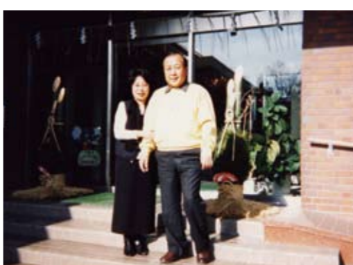
毎年年末に訪れるGR鬼怒川にて。