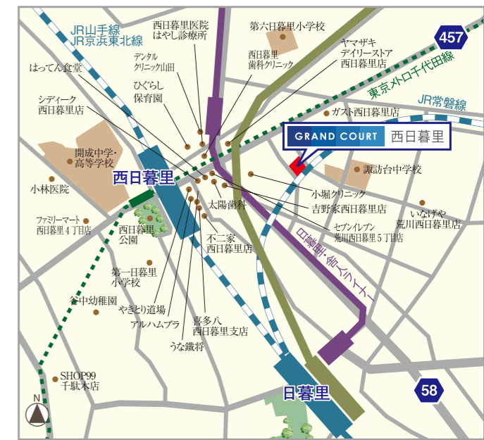
※距離表示については地図上の観測距離を、徒歩分表示については80m/1分として算出(端数切り上げ)したものです。※公立の通学指定校は平成22年11月現在のもので、入居時には教育委員会の指示により変更になる場合があります。※表示内容は、平成22年11月の調査時点のもので、※アクセスの表示分は日中平常時の所要時間で、時間帯により多少異なる場合がございます。また、乗り換え、待ち時間等は含まれません。

■「グランコート西日暮里」概要●所在地/東京都荒川区西日暮里5丁目5番7地(地番)●交通/JR山手線・JR京浜東北線「西日暮里」駅 徒歩5分、東京メトロ千代田線「西日暮里」駅 徒歩4分、JR山手線・JR常磐線・京成線「日暮里」駅 徒歩7分●地域/地区/準工業地域、中高層居住専用地区●防火指定/防火地域●地目/宅地●建ぺい率・容積率/80%・400%●私道負担/無●敷地面積/272.80㎡●建築面積/175.50㎡●建築延床面積/1347.42㎡●構造・規模/鉄筋コンクリート造 地上9階●総戸数/16戸●間取り/1LDK+S~2LDK●住居専有面積/60.15㎡,66.37㎡●バルコニー面積/11.43㎡,21.82㎡●ルーフバルコニー/無●テラス/無●自転車置場/32台(使用料月額300円)●バイク置場/4台(使用料月額1,500円)●土地権利/所有権●分譲後の権利形態/建物の専有部分は区分所有権、建物の共有部分及び敷地は建物専有持ち分割による所有権の共有。●入居後の管理形態/区分所有者全員による管理組合を結成し、管理会社へ委託して頂きます。●完成予定/平成23年3月上旬(予定)●入居予定/平成23年3月中旬(予定)●設計・監理/株式会社スタイルックス●施工/日本建設株式会社 東京支店●売主/株式会社大倉●建築確認番号/第H21 A-JCL a. 00650-01号●第2期)概要●販売戸数/6戸●販売価格/3,846.0万円~5,229.5万円●管理費(月額)/16,200円~17,900円●修繕積立金(月額)/3,600円~4,000円●修繕積立基金(引渡時一括)/481,000円~531,000円●広告有効期限/平成23年4月末日