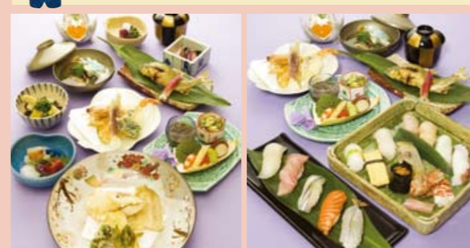
天ぷら会席 寿司会席

ボリュームアップ会席 量が少し物足りないというお客様や若い方にもご満足いただけるボリュームたっぷりの献立をご用意いたしました。