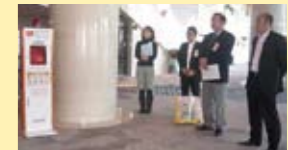
プリンセス有馬での合同講習には、元プロ野球選手の佐野慈紀さんも参加。