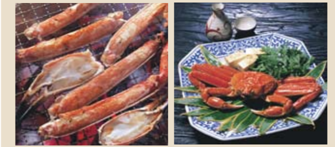
■カニ料理をお楽しみいただけるホテル一覧

実施期間 3月31日(木)まで 期間中、城崎・天の橋立・加賀・三方五湖では、通常料金でのご宿泊もカニづくし料理となります。 ■天の橋立:梅カニ会席(1泊目) 通常会席(2泊目) ■加賀・三方五湖:カニ会席(1泊目) 通常会席(2泊目)