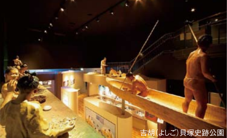
吉胡(よしご)貝塚史跡公園

三方五湖 (車30分) みなとつるが山車(やまこま)会館 (車30分) 負け戦と分りながら石田三成との友情のために散った義将大谷吉継(敦賀城主)の展示コーナーがあり、人気を集めている。また、敦賀まわりで巡行する勇壮華麗な山車6基を収納。 金ヶ崎城跡・金ヶ崎宮 (車30分) 織田信長の越前朝倉攻めの途中で落城。浅井三姉妹の母お市の方が信長に渡した「小豆袋」のエピソードが伝えられている。小高い山にあるため眺望もよく、桜の名所としても知られている。 日光東照宮 (車50分) 江戸幕府をひらいた徳川家康を祀る神社。有名な「三猿」や「眠り猫」「鳴竜」など、数々の国宝、重要文化財が点在している。 二荒山神社 (車50分) 下野国の宮として古くから信仰を集める神社。1200年以上前に勝道上人が創建、現在の本社社殿は東照宮創建と前後し徳川2代将軍秀忠が造営。日光最古の建物であり、福縁結びの神社として知られる。