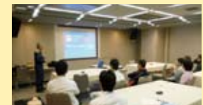
GRE京都で行われた救命講習&AED講習会。

ザ グラン リゾートの各ホテルに、AED(自動体外式除細動器)を設置。さらなる設備の向上に努めています。