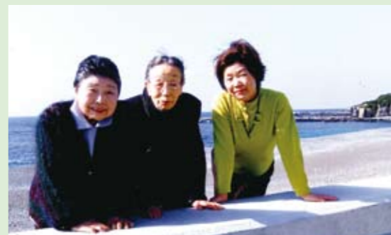
GRE白浜にお母様とご友人、奥様と4人で出かけられたときの写真。お母様とお友達は60年来のお付き合いだとか!

叔母の3人を連れて旅行に出かけるんです。自分たちだけで遠出するのは大変な年齢ですが、私が運転して、途中で道の駅や野菜の市場に寄ってあげると、喜んで買い物を楽しんでいますね。そして、GRのホテルに着いたらあと