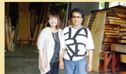
銘木やサロン経営で多忙な日々の合間、ザグランリゾートで過ごすひとときが貴重なリラックスタイムに。

ザグランリゾートが、 いろいろな所へ出かける きっかけをくれた。 人生をゆたかにして もらったわ。