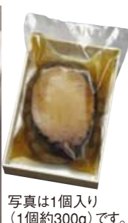
写真は1個入り (1個約300g)です。