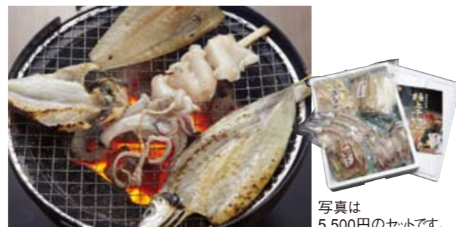
写真は 5,500円のセットです。

日本海山陰沖で獲れた海の幸を、お得なセットに。肉厚で脂がたっぷりのったベラカレイや、地元の漁師達にも人気でなかなか外に出回らないモサエビ、自身でさっぱりしたカマス、噛めば噛むほど旨味が増す白イカの一夜干しなど、プロの仲買人が選んだ極上品を詰め合わせました。