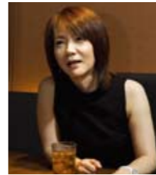
歌手 香西 かおりさん