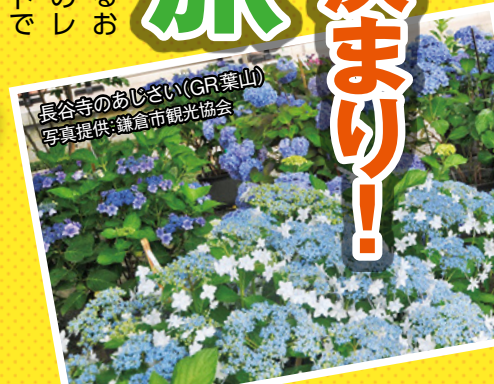
長谷寺のあじさい(GR葉山)