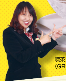
喫茶かわぐち (GR伊良湖)