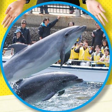
和歌山 マリーナシティ (GR和歌の浦)