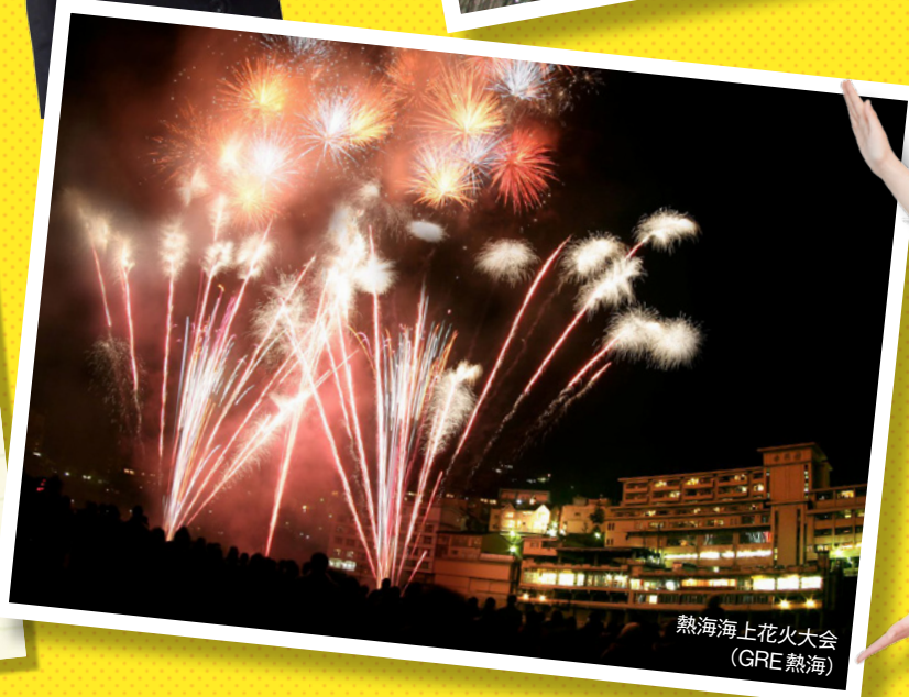
熱海海上花火大会 (GRE熱海)