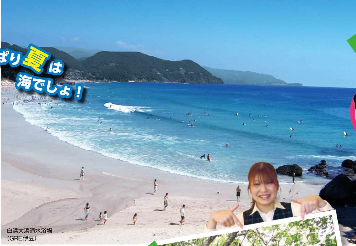
白浜大浜海水浴場 (GRE伊豆)