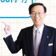
GR伊良湖 河合支配人