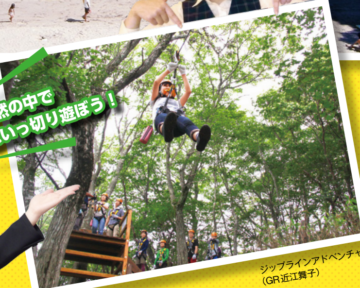
ジップラインアドベンチャー (GR近江舞子)