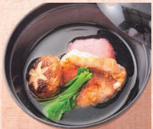
椀物 清汁仕立て 若狭ぐじ 若狭湾で取れるアマダイは「若狭ぐじ」と呼ばれる高級食材。淡泊ながら上品な甘みを生かし、薄塩で軽く焼いています。