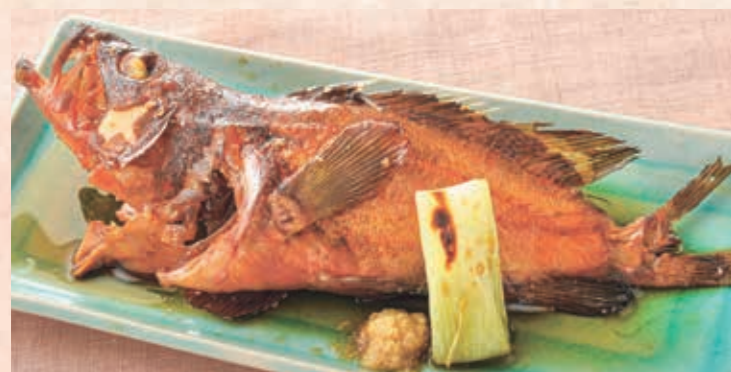
煮付け 若狭地魚煮付け 煮付けは一匹まるごと姿で提供。あめ色に照り輝く身は、タレがしみ込みコクたっぷり。