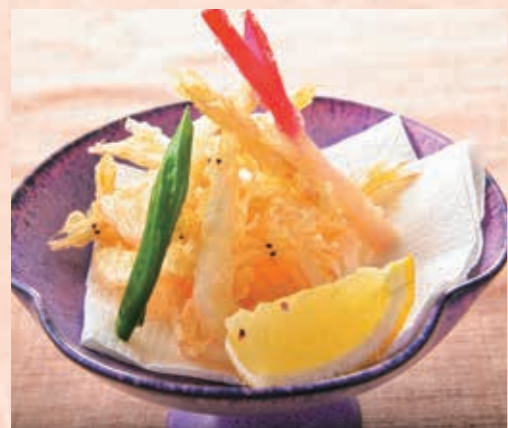
揚げ物 白海老から揚げ 白海老は富山名産と思われがちですが、若狭湾でも水揚げされます。さくっと香ばしく、海老の風味がふんわり軽やか。