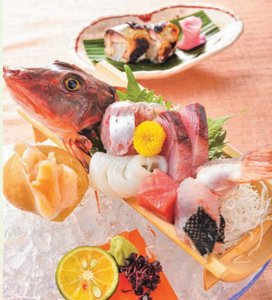
造り 若狭地魚盛り 鮮魚の姿造りはあっと驚く見た目と、ボリュームたっぷりの一品。ご夫婦やご家族など人数に合わせて大皿でご提供します。あまりお目にかかれない魚との出会いも一興です。脂が乗った凌ぎの焼き鯖寿司は、ぜひ食べておきたい名物。