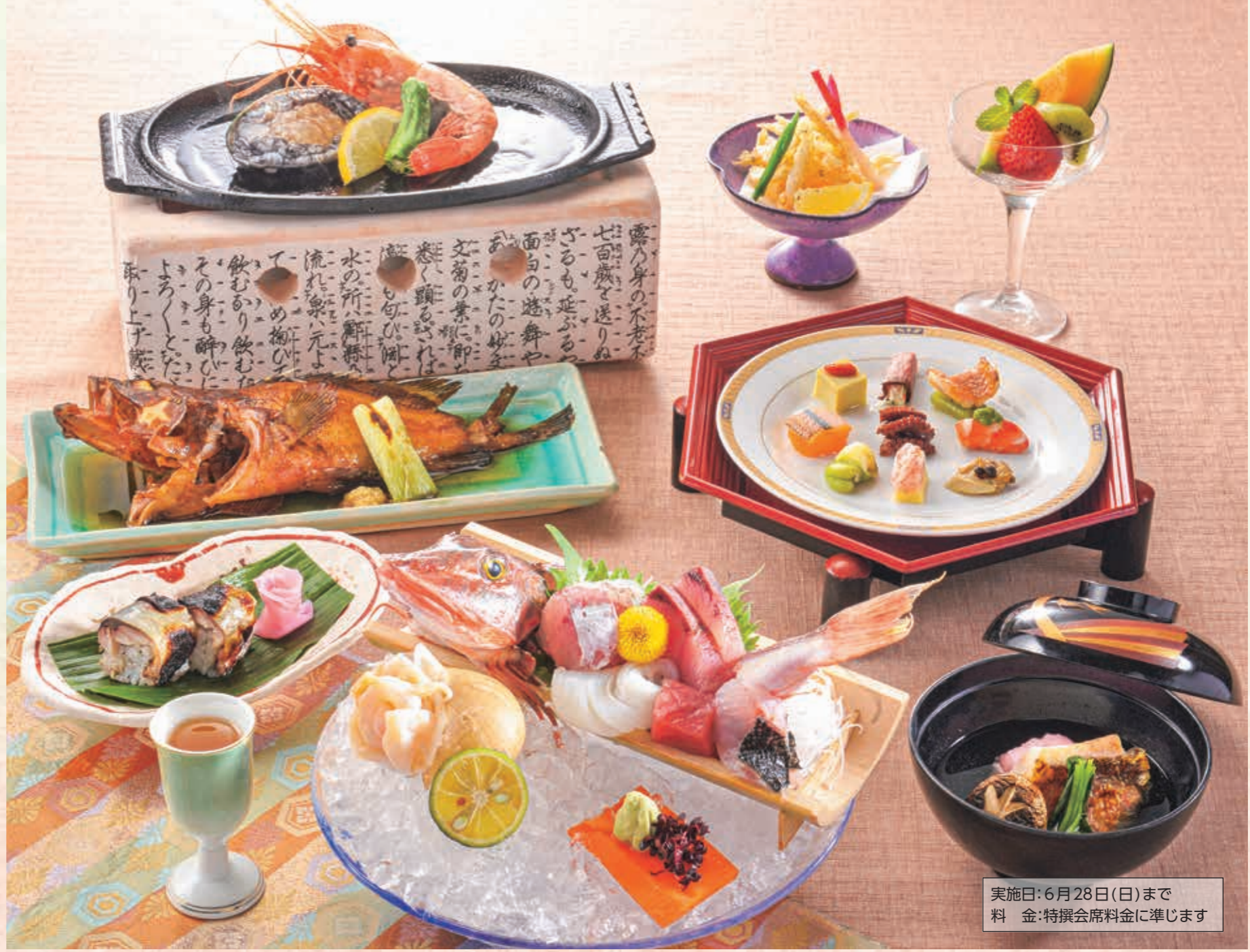
実施日：6月28日(日)まで 料 金：特撰会席料金に準じます