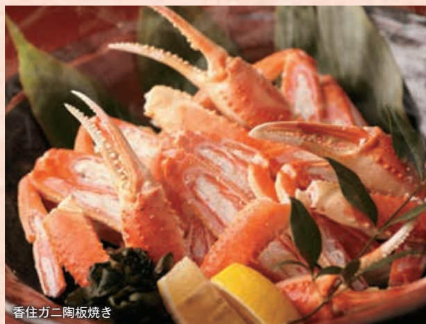
香住ガニ陶板焼き

会席名を見て、「おやつ、まだカニが？」と思われた方も少なくないはず。今回のカニは、秋から初夏にかけて取れる紅ズワイガニ。中でも香住漁港で水揚げされるものは「香住ガニ」と呼ばれ、品質の良さは地元では知らぬ者がいないほど。香住ガニは、造りと酒蒸し、陶板焼きで召し上がっていただきます。鮮度抜群の証拠に甘みの強さ、みずみずしさが高貴なこと。城崎だからこそ味わえるカニの美味です。 香住ガニのほか、鮑は椀物、やわらか煮、ロブスターは歯ごたえのある具足煮でご提供。三種の海の幸が織りなす味わいの重なりをぜひお楽しみください。