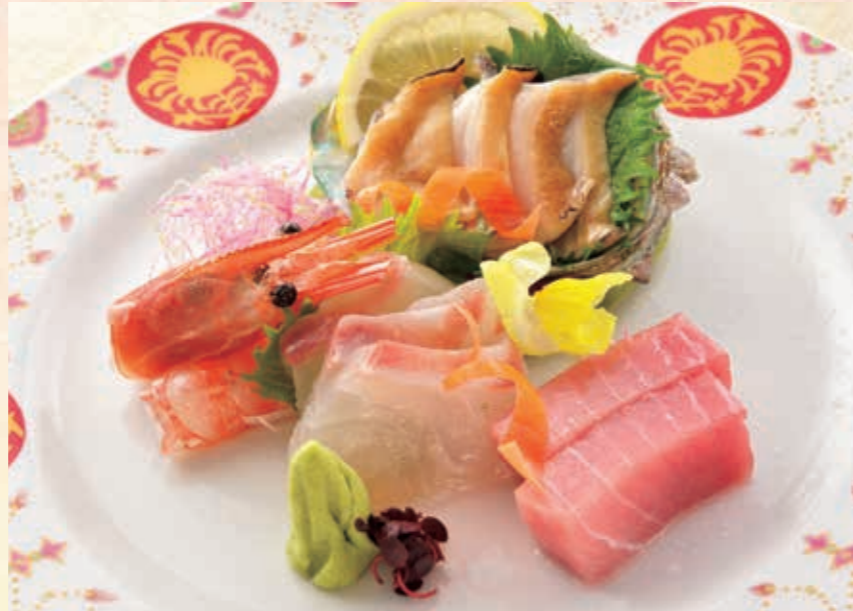
造り 鮑殻盛り、梅鯛、本マグロ、ポタンエビ 南高梅のエキスを配合した飼料で育てられた梅鯛は、身の質、脂の乗りが良く、天然鯛にも劣らぬおいしさ。肉厚な鮑は、コリッとした歯応えで噛むほどに磯の風味が広がります。