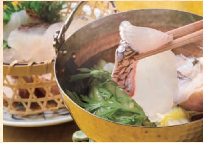
鍋物 鯛しゃぶしゃぶ 昆布出汁にさっとぐらせ、ごまポン酢をつけて。余分な脂が落ちてさっぱりとした味わい。