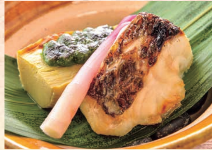
焼き物 鯛山椒焼き 甘いタレで漬けて焼いてしっかり味がしみ込ませ、仕上げに粉山椒をひと振り。筍の木の芽田楽を添えて。