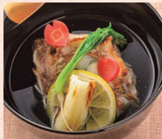
椀物 椀種は香り豊かな鯛の酒蒸し。鯛の頭部分は、コラーゲンたっぷりです。プリプリとした食感。レモンの酸味がアクセントです。