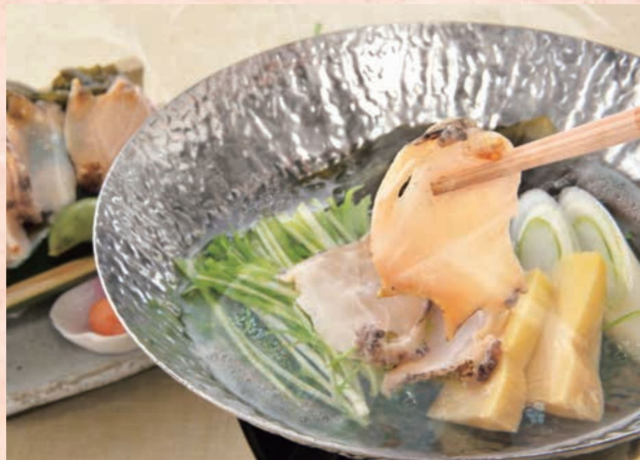
鍋物 鮑しゃぶしゃぶ 鮑まるごと1個を、お好みの火加減で心ゆくまで味わえます。さっと湯に通した「半生がおすすめ」とは料理長中野。