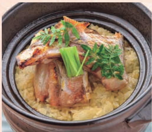
食事 鯛ご飯 頭とアラは焼き上げてから、ふっくら炊き上げ鯛ご飯に。ご飯一粒一粒に鯛のうまみが染み渡ります。