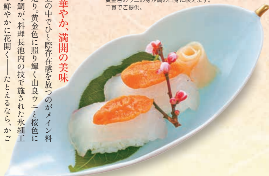
しのぎ 由良ウニ・鯛握り寿司 黄金色のウニの身が鯛の白身に映えます。二貫でご提供。