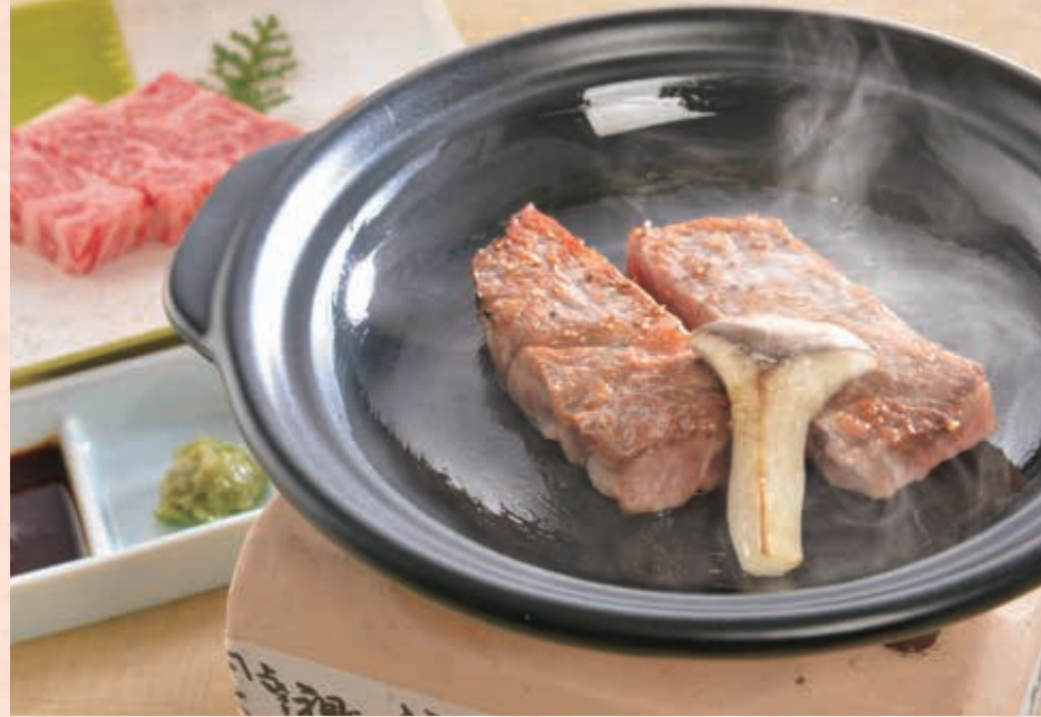
焼き物 熊野牛サーロイン陶板焼き 和歌山県特産の高級和牛「熊野牛」の肉質はきめ細やかで柔らかく、サーロインながら、脂が少なくあっさりとした味わいです。