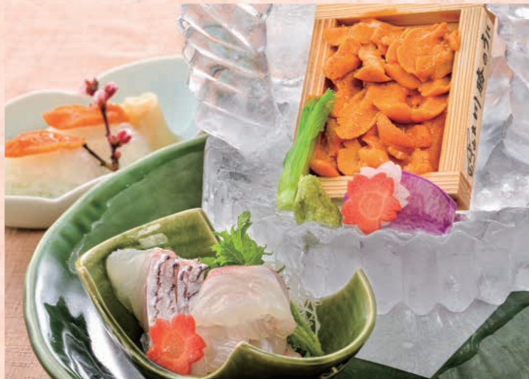
造り 由良ウニ・鯛 淡路島産の由良ウニは腹を見せて盛るのが特徴。「逆手のウニ」と呼ばれ、板の上に波立つようにピンと立つ姿は鮮度の良さがあってこそ。