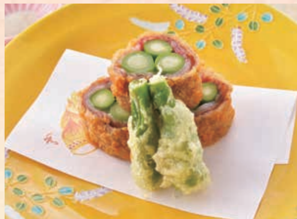
揚げ物 熊野牛ロースクラッカー揚げ サクッとした衣からジューシーな肉汁がじゅわり、熊野牛で巻いたアスパラガスの歯応えとコンビネーションが絶妙です。